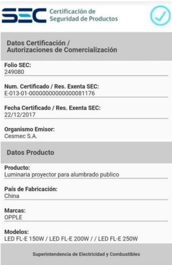
Imagen 1. Respuesta a requerimiento de información.