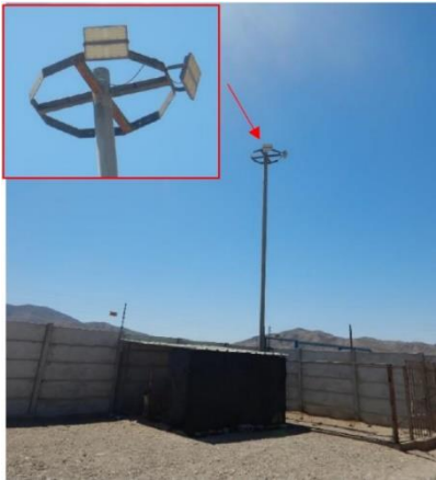
Ilustración N° 4. Luminaria N° 3, proyectores industriales sin información de modelo, marca, potencia, u otro antecedente, ubicada en esquina noroeste del perímetro de la instalación (Fotografía 7 IFA).