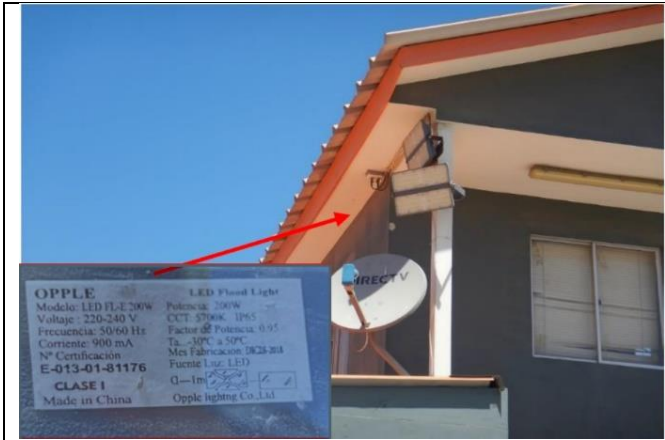
Ilustración N° 1. Luminaria N°1, marca Oppla, modelo Led FL-E 200 W, tipo Led, con potencia nominal de 200 w, ubicada en sector garita de acceso (Fotografía 2 IFA).