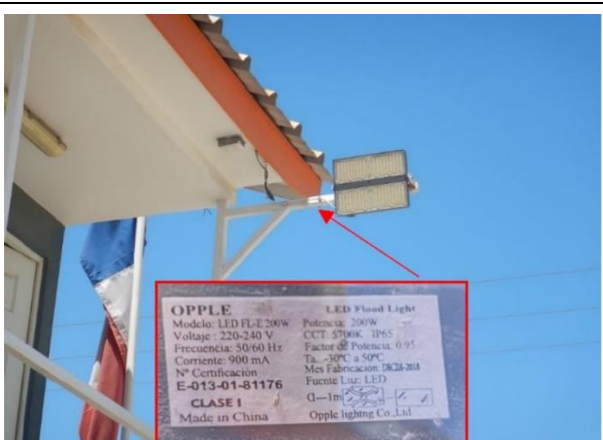
Ilustración N° 2. Luminaria N° 1, marca Oppla, modelo Led FL-E 200 W, tipo Led, con potencia nominal de 200 w, ubicada en sector garita de acceso (Fotografía 3 IFA).