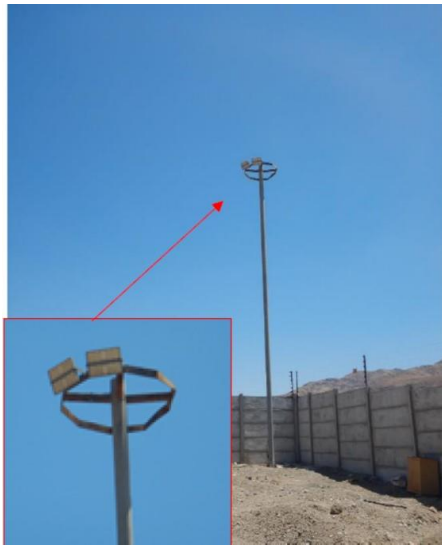
Ilustración N° 5. Luminaria N° 4, proyectores industriales sin información de modelo, marca, potencia, u otro antecedente, ubicada en esquina suroeste del perímetro de la instalación (Fotografía 8 IFA).

18° Las luminarias de GS Rental constituyen fuentes de alumbrado industrial –según constató personal fiscalizador de esta Superintendencia– que emite un flujo luminoso al hemisferio superior, generando una distribución de intensidad luminosa 3 mayor que 0 cd/klm 4 por sobre los 90° del ángulo gama, y, por lo tanto, exceden el límite de emisión establecido en el artículo 6 N° 2 del D.S. N° 43/2012.