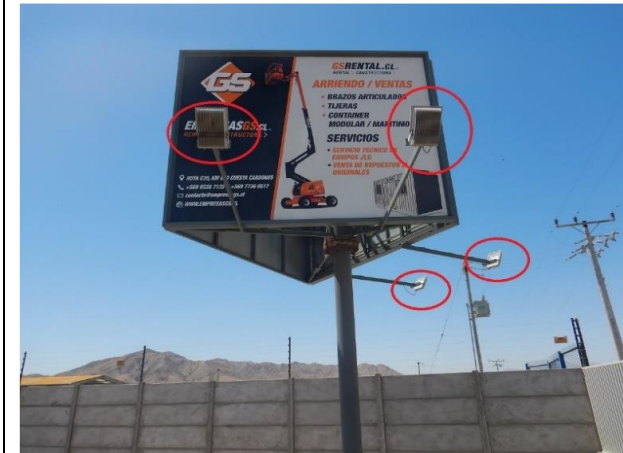
Ilustración N° 3. Luminaria N° 2, proyectores industriales marca DRL Modelo SL-150/100W, potencia nominal de 100 w, ubicada en esquina noreste del perímetro de la instalación (Fotografía 6 IFA).