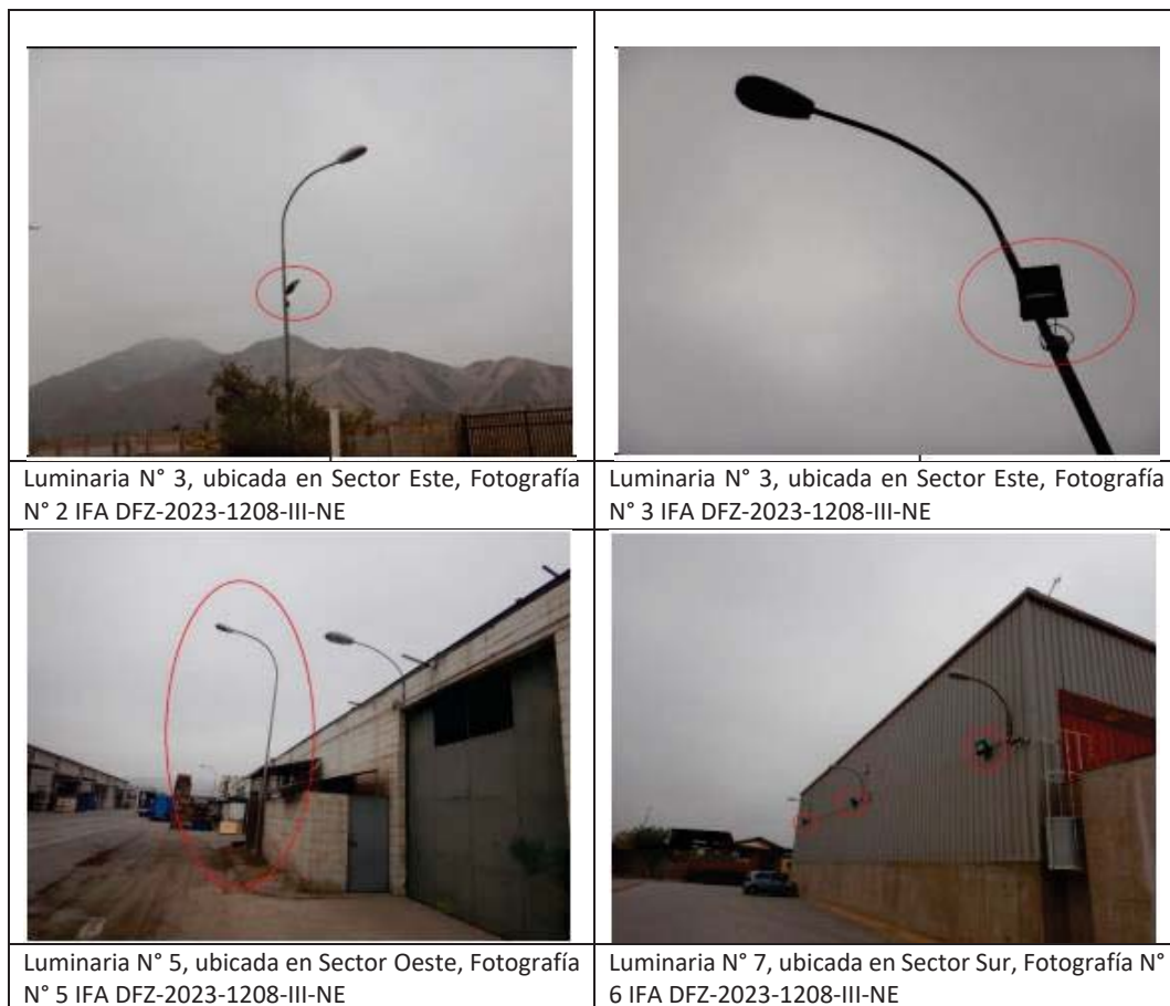
Imagen 2. Fotografías Luminarias Sectores Plaza Comercio 2

18° Lo anterior se ve corroborado en las fotografías acompañadas al Informe de Fiscalización DFZ-2023-1208-III-NE, en que se observa que las luminarias se encuentran instaladas de forma tal que sus emisiones de luz excederían el ángulo gama 90°. Las siguientes imágenes corresponden a algunas de las fotografías referidas: