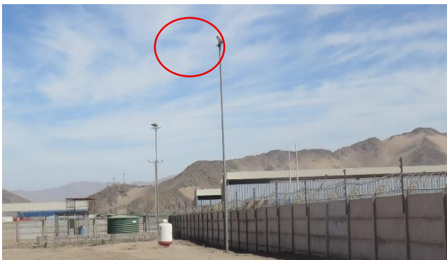
Ilustración N° 3. Luminaria N° 9, tipo LED, sin información visible de marca, modelo ni potencia, ubicada en la zona central del perímetro norte (Fotografía 5 IFA).