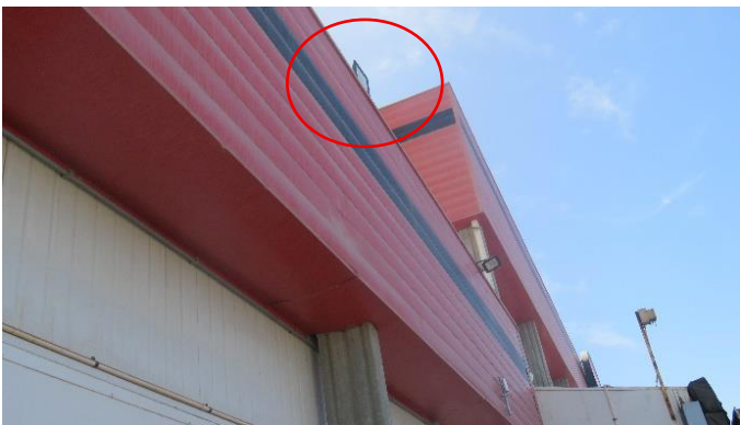
Ilustración N° 4. Luminaria N° 13, tipo LED, de 100 W de potencia, sin información visible de marca ni modelo, ubicada en el contorno sur (Fotografía 9 IFA).