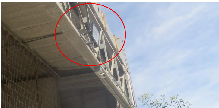
Ilustración N° 5. Luminaria N° 14, proyectores tipo LED, de 150 W de potencia, sin información visible de marca ni modelo, ubicados en la zona de carga de camiones, contorno sur (Fotografía 15 IFA).