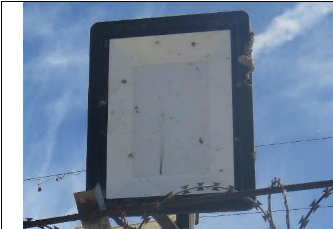
Ilustración N° 2. Luminaria N° 2, tipo LED, potencia nominal de 200 W, sin información visible de marca ni modelo, ubicada en la zona central del perímetro frontal. (Fotografía 2 IFA).

18° En el Acta de Inspección Ambiental levantada con fecha 16 de noviembre de 2023, se constata en relación con las luminarias de Centro de Distribución Ariztía Copiapó, que las luminarias N° 2, N° 3, N° 4, N° 7, N° 8, N° 9, N° 12, N° 13, N° 14, N° 15, N° 17 y N° 18 identificadas en la Tabla N° 1 se encuentran instaladas “con un ángulo gamma mayor a 90° proyectando luz hacia el hemisferio superior [...]”. Lo anterior, se puede corroborar en las fotografías incorporadas en el Informe de Fiscalización DFZ-2023-2899-III-NE, en que se observa que las luminarias se encuentran instaladas de forma tal que su emisión de intensidad luminosa excedería los niveles permitidos para un ángulo gama mayor a 90°.