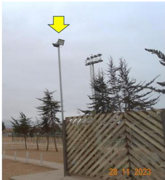
Luminaria N° 4, ubicada en s en camino de ingreso al centro deportivo, Fotografía N° 10, IFA DFZ-2023-2951-IV-NE