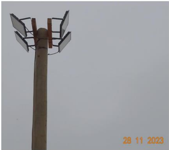
Luminaria N° 4, ubicada en s en camino de ingreso al centro deportivo, Fotografía N° 13, IFA DFZ-2023-2951-IV-NE

Fuente: Elaboración propia a partir de las fotografías contenidas en el IFA 2023.