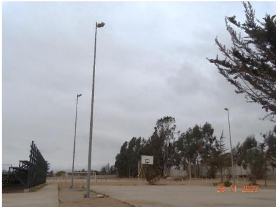
Luminaria N° 3, ubicada en cancha de basquetbol, Fotografía N° 8, IFA DFZ-2023-2951-IV-NE