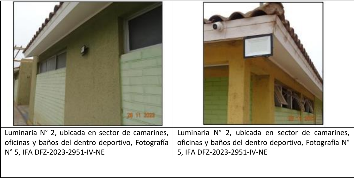
Imagen 2. Fotografías Luminarias Sectores Complejo Deportivo El Milagro

16° Lo anterior se ve corroborado en las fotografías acompañadas al Informe de Fiscalización DFZ-2023-2951-IV-NE, en que se observa que las luminarias se encuentran instaladas de forma tal que sus emisiones de luz excederían el ángulo gama 90°. Las siguientes imágenes corresponden a algunas de las fotografías referidas: