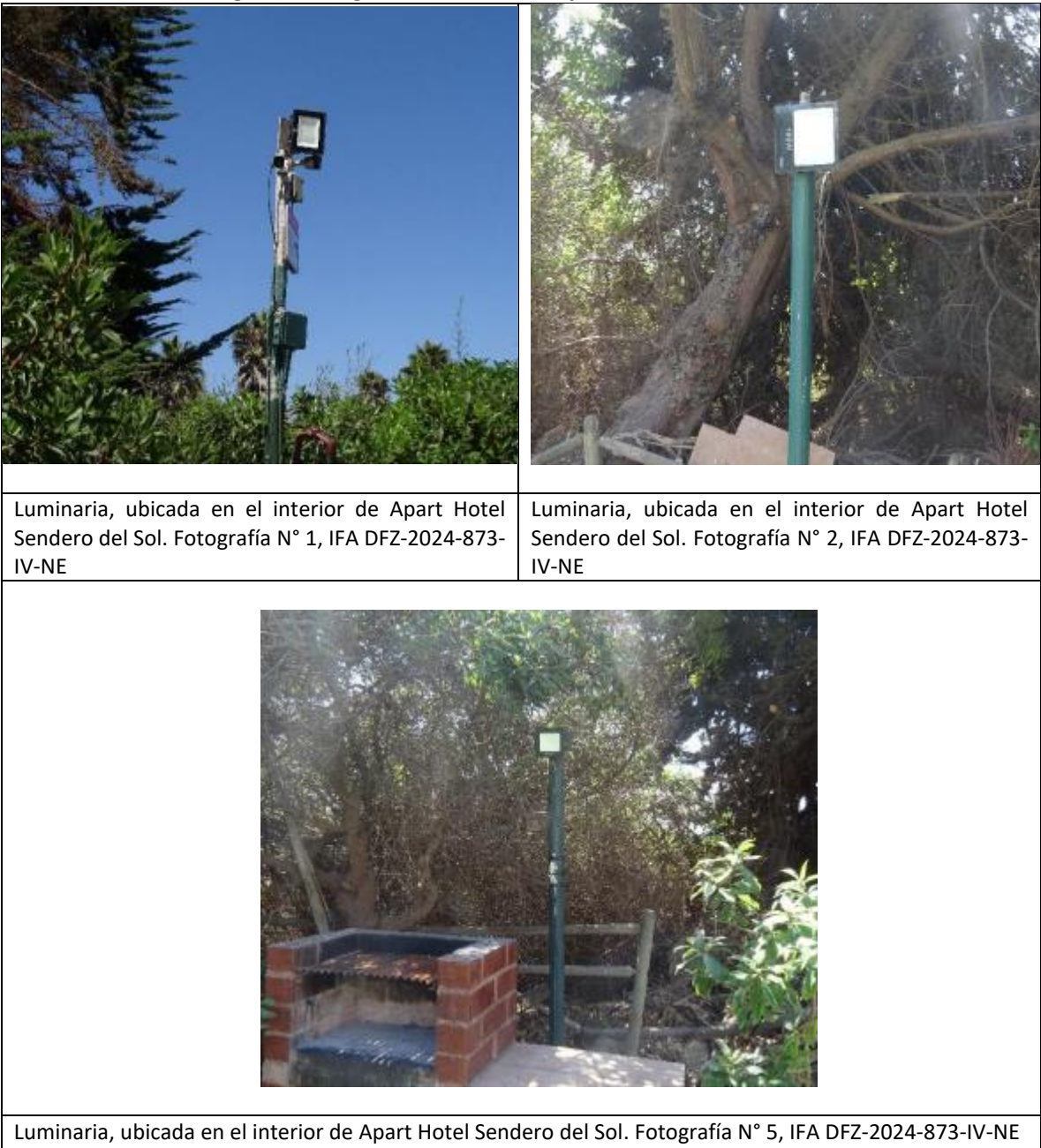
Imagen 2. Fotografías Luminarias Apart Hotel Sendero del Sol