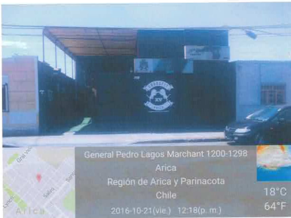
Frontis del gimnasio.