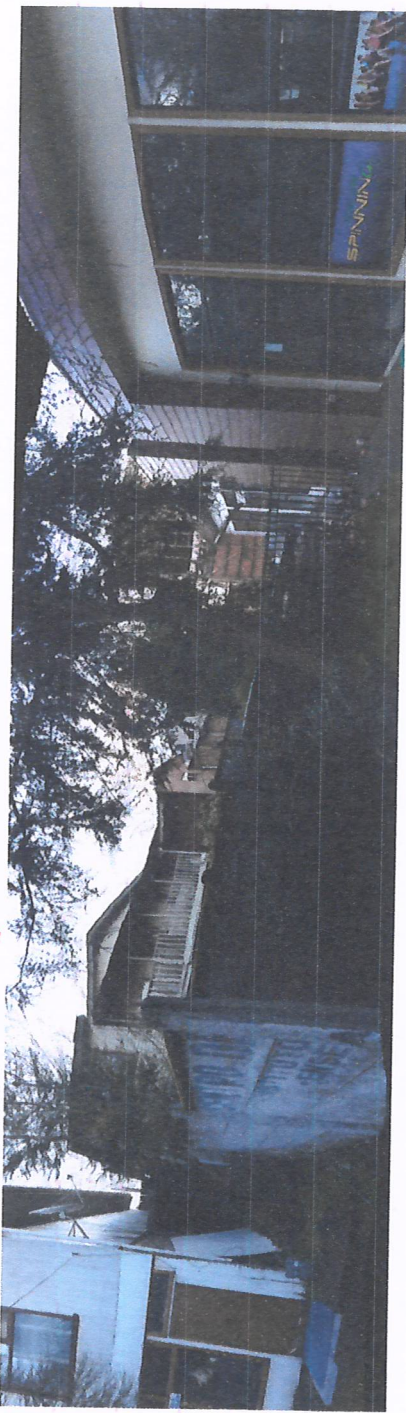
FOTOGRAFIA DE PANDERETA EXISTENTE, SOBRE ESTA SE CONTRUYE EL MURO.