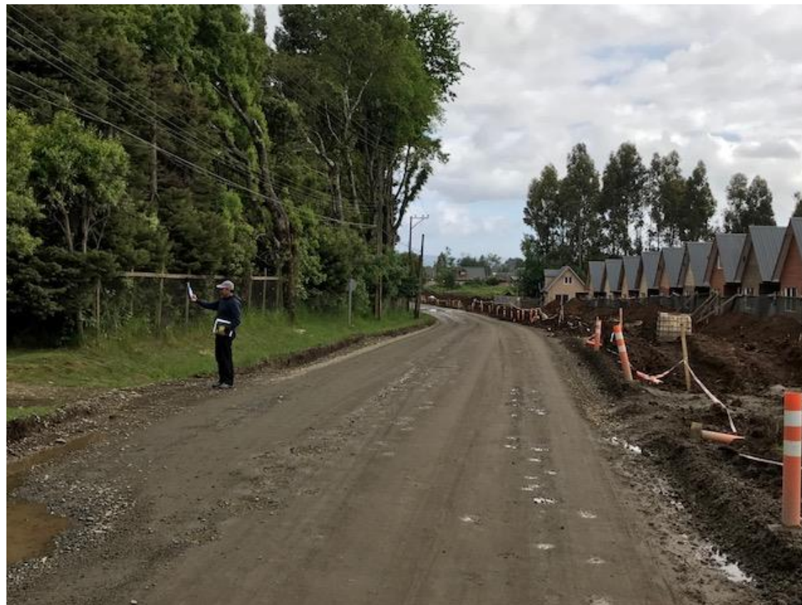
Imágenes de la Ruta 424 Camino a Angachilla, frente a la etapa 1 y 2.