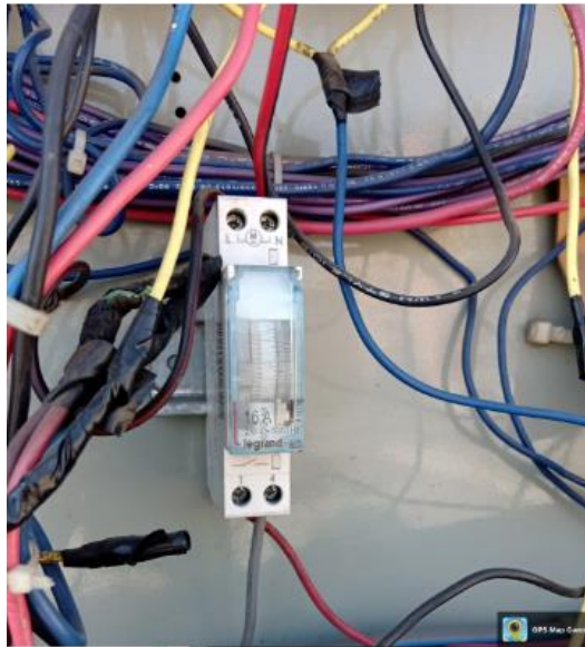
Fotografías Timer a equipos de Extracción