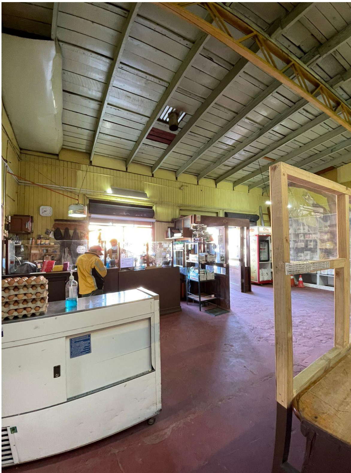
Almacenes Ordenes e Hijos Ltda.