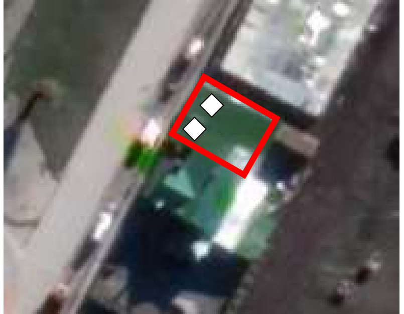
Fig.1 Broadway restobar av. Bulnes 0603.

indicando las dimensiones del establecimiento, y señalando la ubicación de el/los emisores de ruidos.