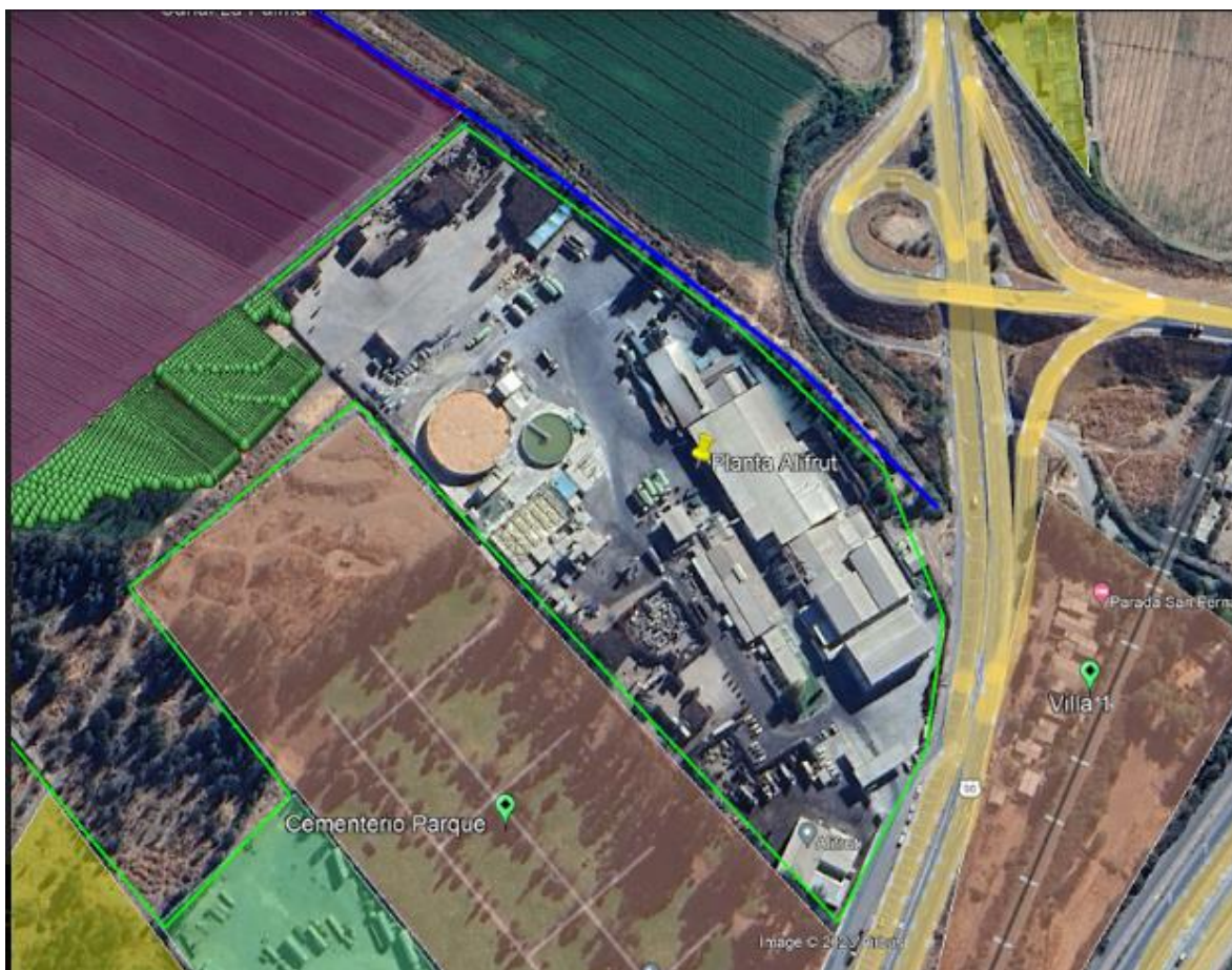
Figura N°1: Ubicación del proyecto.

El proyecto objeto del presente procedimiento sancionatorio consiste en una planta de tratamiento de residuos industriales líquidos (RILES) de la agroindustria procesadora de Alimentos y Frutos (ALIFRUT) S.A., ubicado en Av. Camino Santa Cruz, kilómetro 3, comuna de San Fernando, Región del Libertador General Bernardo O’Higgins.