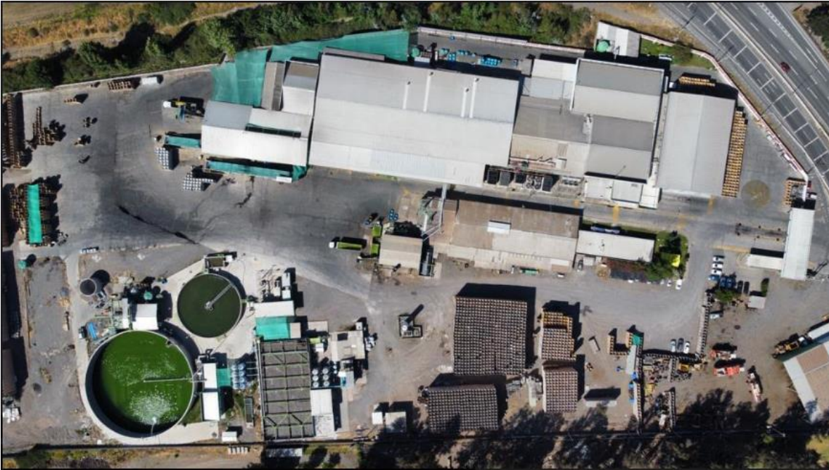
Figura N°2: Ubicación Proyecto.