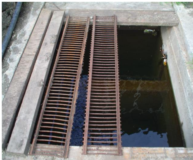
Pre-Tratamiento de Riles: Decantador Primario de Sólidos