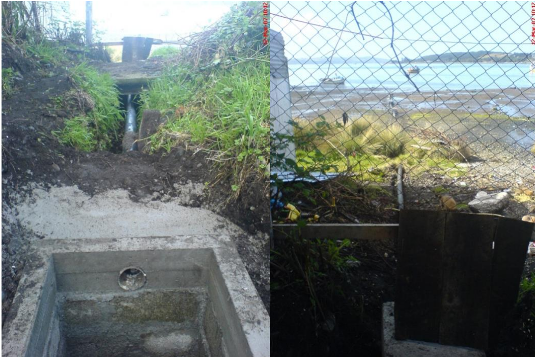
Cámara de Muestreo y Emisario Submarino

El emisario submarino está construido con una tubería de Polietileno de Alta Densidad, de diámetro 110 [mm] exterior, PN 10 PE 100, de 435 metros aproximadamente. Las tiras de 12 [m] de tubo que la conforman están unidos entre sí por el sistema de termofusion. El emisario submarino se fijó al fondo por medio de muertos de 80 [kg] de peso (en seco) considerado para una corriente de 1.5 nudos, distanciados cada 3 metros aproximadamente. En la punta de descarga del emisario se utilizó un difusor de \varnothing 63 [mm] a fin de aumentar la capacidad de dilución de los Riles.