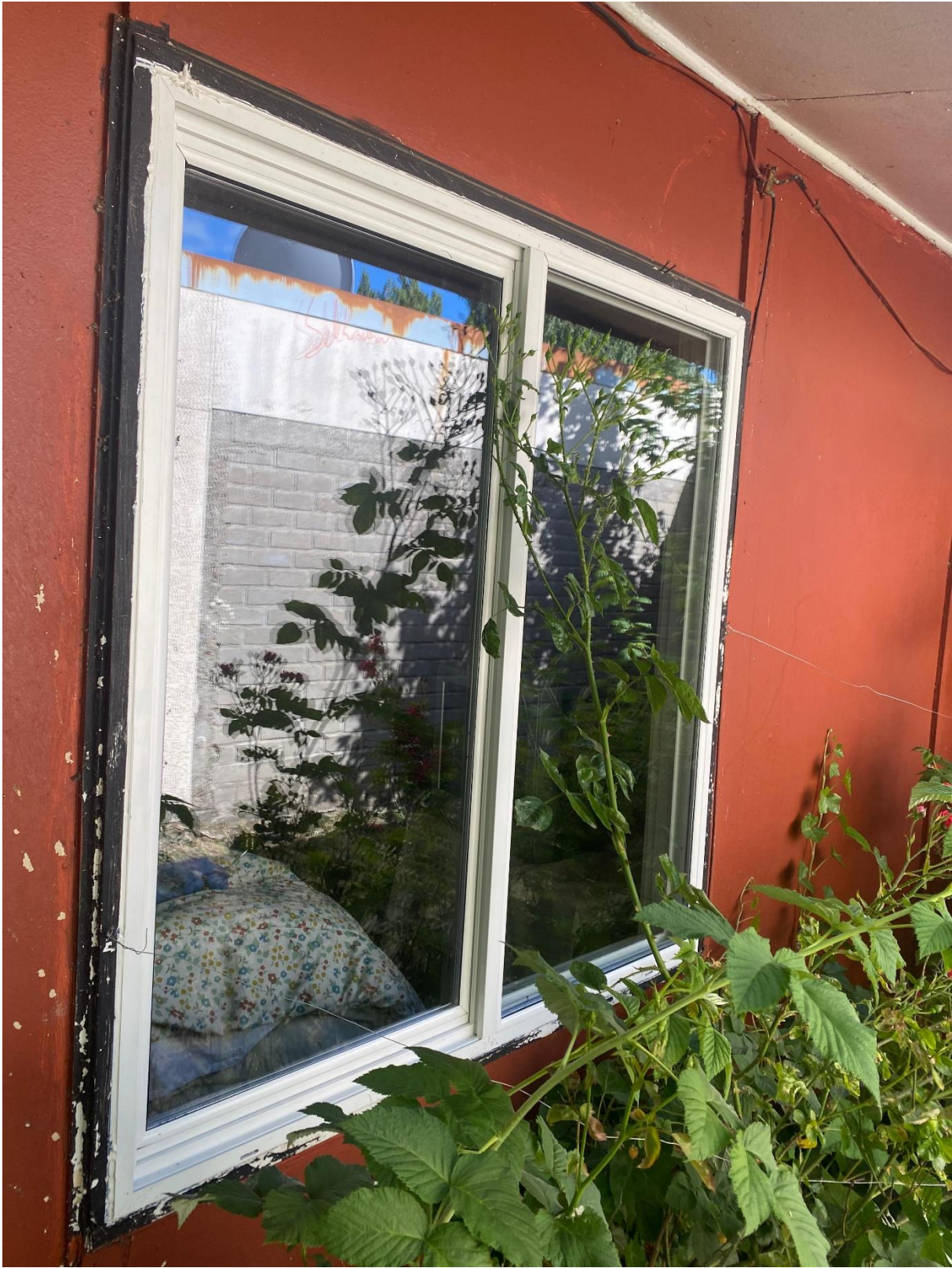
4. VENTANAS ABATIBLES PARA CIERRE DE TERRAZA POR CALLE PORTALES