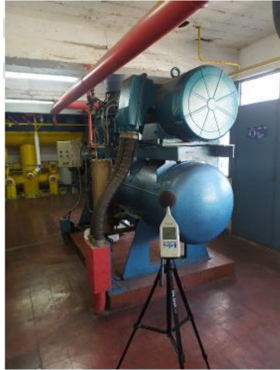
Compresor Tornillo Gram