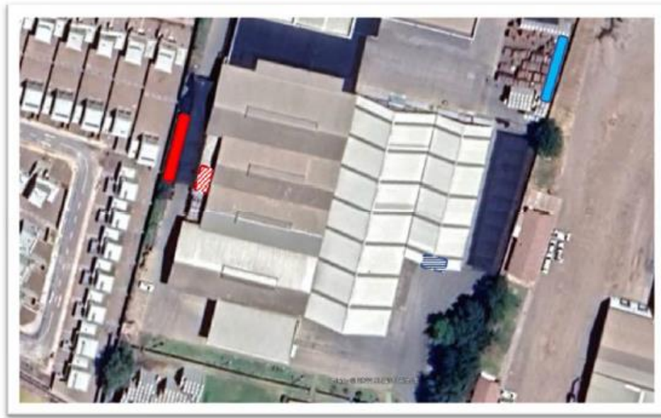
Imagen 5. Traslado Taller de Mantenición

Fichas o informes técnicos (en caso de marcar “Otra” este medio de verificación es obligatorio).