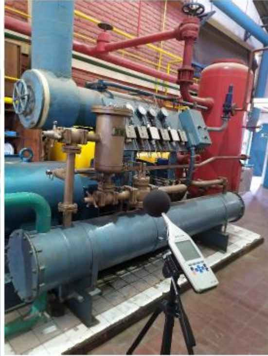
Compresor Tornillo Howden