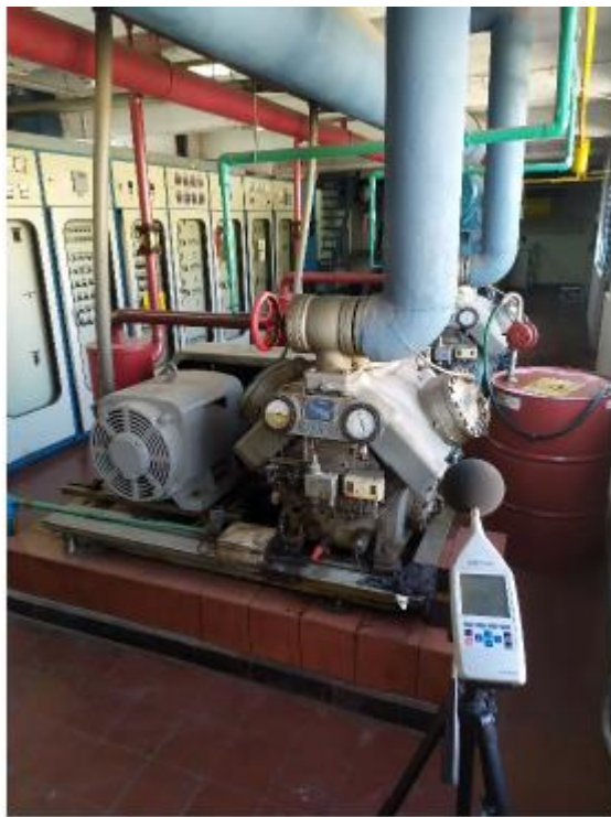
Compresor Piston Sabroe