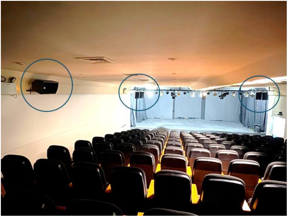
Fotografía 3: Parlantes