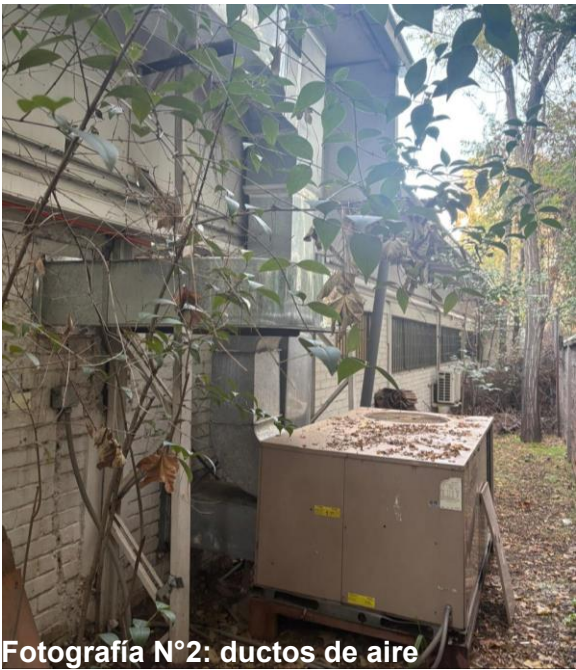
Fotografía N°2: ductos de aire