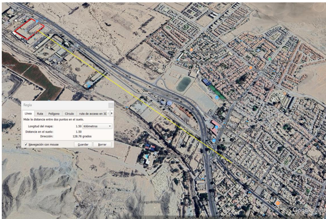
Imagen 1. Imagen Satelital Distancia del Proyecto Ciudad de Copiapó

Los hechos constatados en la formulación de cargos corresponden a incumplimientos de carácter técnico vinculados a los límites de emisión lumínica establecidos en el D.S. N° 43/2012. En concordancia con el objetivo declarado de dicha norma —esto es, prevenir la contaminación lumínica de los cielos nocturnos de las regiones de Antofagasta, Atacama y Coquimbo para proteger su calidad astronómica—, cabe señalar que la unidad fiscalizable se encuentra emplazada en una zona industrial exclusiva según el Plan Regulador Comunal de Copiapó y altamente antropizada, próxima al núcleo urbano de la ciudad de Copiapó (1.5 km aproximadamente). Tal como se aprecia en la imagen satelital que se acompaña, el área corresponde a una “zona lejana”, según la clasificación contenida en el Decreto Supremo N°2 de 2022 del Ministerio de Ciencia, Tecnología, Conocimiento e Innovación, sobre Áreas Astronómicas. En este contexto, no se han verificado impactos ambientales directos o medibles derivados de los incumplimientos observados.