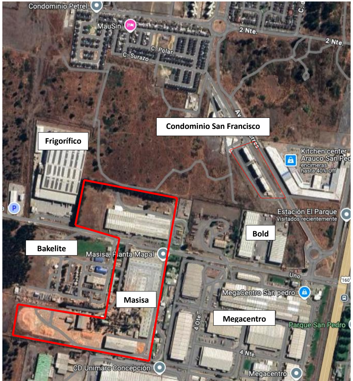
Imagen 1 Situación Planta Mapal

Condominio San Francisco donde se efectuó la denuncia, entre otros. La Imagen N°1 ilustra la ubicación de Planta Mapal en relación con las actividades que la rodean.