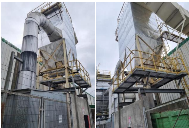
Imagen 3. Filtros de aire Línea 2 y 3 Melamina

A mayor abundamiento, y siempre en cumplimiento de lo ordenado por la Superintendencia, a continuación se acompañan fotografías de las principales fuentes generadoras de ruido de la Planta Mapal, así como el señalamiento de su ubicación.