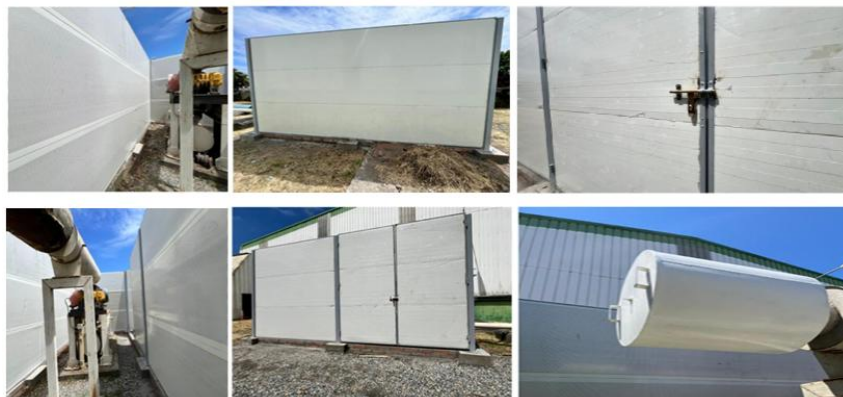
Imagen 6. Ubicación Soplador de Polvo de Terminación, Planta Mapal