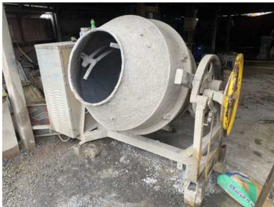
Imagen de Máquina Utilizada