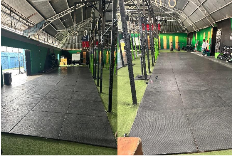
Colchonetes de uso.