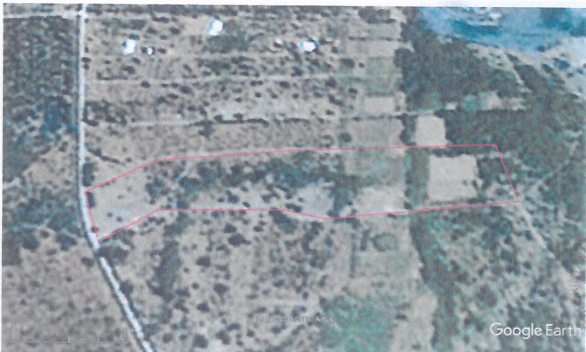
Imagen 1: Fotografía adjunta en descripción de efectos negativos cargo 1.

23. En uno de los Anexos, se indica que en el año 2007, previo a la ejecución del proyecto, en el sector existía de aramo australiano ( Acacia melanoxylon ) en bosque abierto similar a la que se tiene actualmente en el predio de límite sur, con pocos ejemplares nativos de boldo ( Peumus boldus ) y quillay ( Quillaja saponaria ). Para acreditar lo anterior se adjunta la siguiente fotografía de Google Earth de 28 de abril del año 2018: