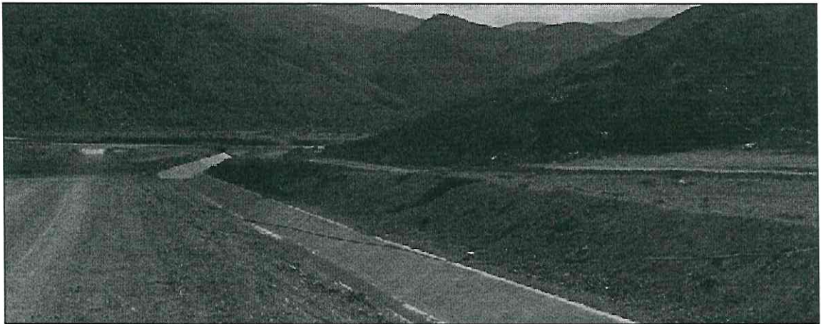
Canalón de desembocadura de Caudal hacia canalización construida en Quebrada de Taltal