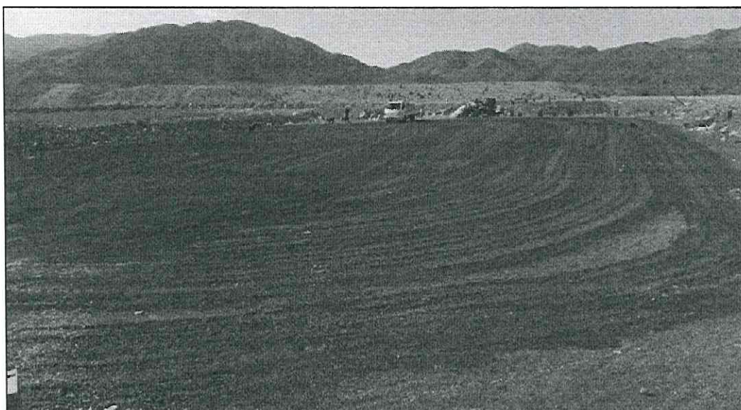
Relleno Sanitario Municipal, después de operación de Regadío

2. Descargo específico: En estricto rigor, la Ilustre Municipalidad efectúa monitoreo de percolados de forma mensual, y frente a la eventualidad de lluvias, el monitoreo es a las 24, 48 y 72 horas posteriores al evento lluvia. Dicho monitoreo se ejecuta en pozo de monitoreo, que se encuentra dispuesto aguas abajo de las celdas,