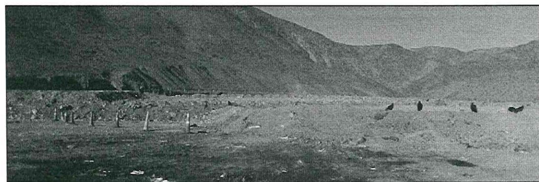
Cobertura de Material de Suelo. Relleno Sanitario Municipal