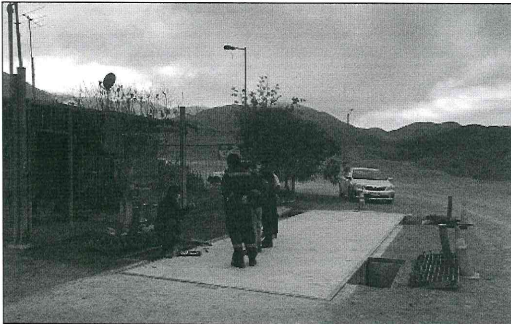
Visita a terreno, revisión bascula de pesaje.