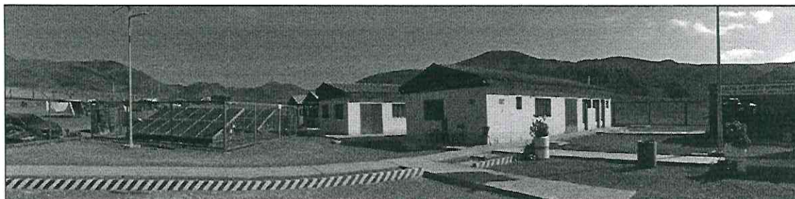
Instalaciones del Centro de Esterilización Canina de Taltal

responsable, que entrega servicios veterinarios al conjunto de animales, con enfoque principal en los nichos ecológicos en condición de calle o abandono. Sin perjuicio de lo anterior, la Ilustre Municipalidad se encuentra trabajando en la puesta en Operación de las instalaciones del Centro de Esterilización Canina de Taltal.