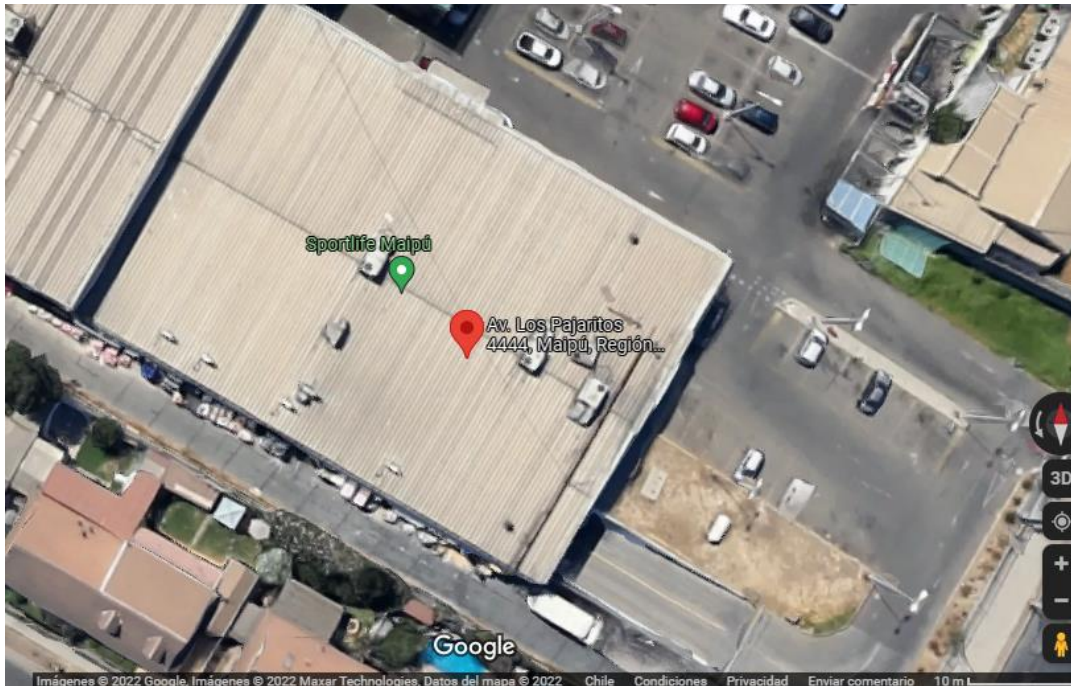
Ilustración 4 Imagen satelital de la sede, donde se aprecian las salidas de ventilación