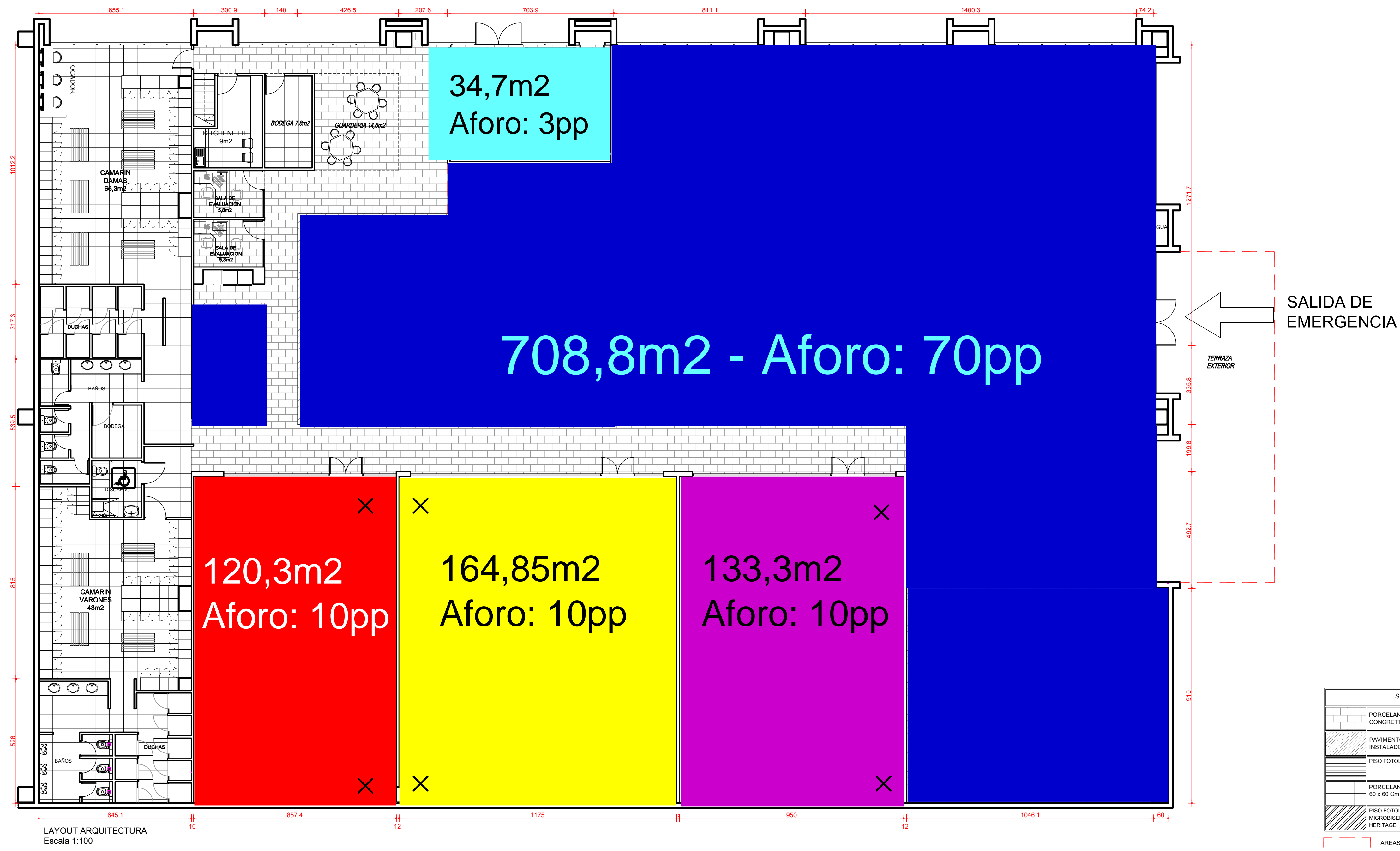
LAYOUT ARQUITECTURA Escala 1:100