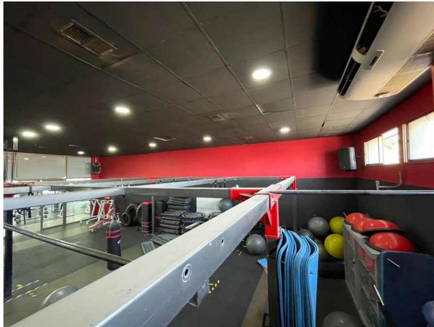
Ilustración 2 Sala de entrenamiento funcional. Fotografía de fecha 02 de febrero de 2022, ubicación: Pajaritos 444, Maipú