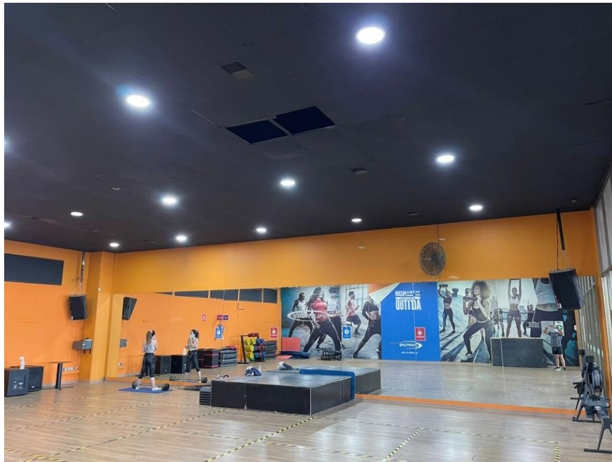
Ilustración 3 Sala de Cycling. Fotografía de fecha 02 de febrero de 2022, ubicación: Pajaritos 444, Maipú

Respecto de las fuentes de posible generación de ruido, podemos determinar que pueden ser tres: