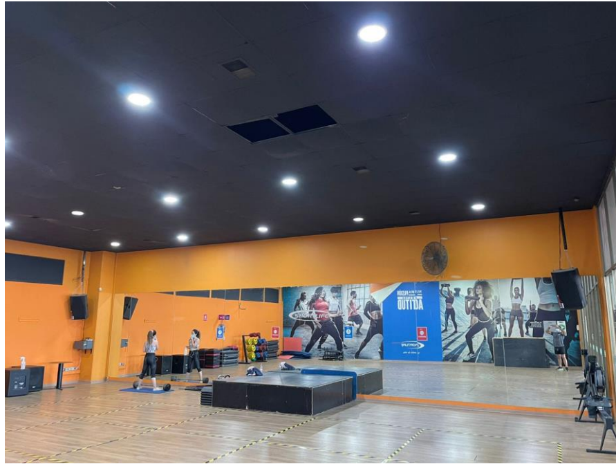
Ilustración 1 Sala AADD. Fotografía de fecha 02 de febrero de 2022, ubicación: Pajaritos 444, Maipú.