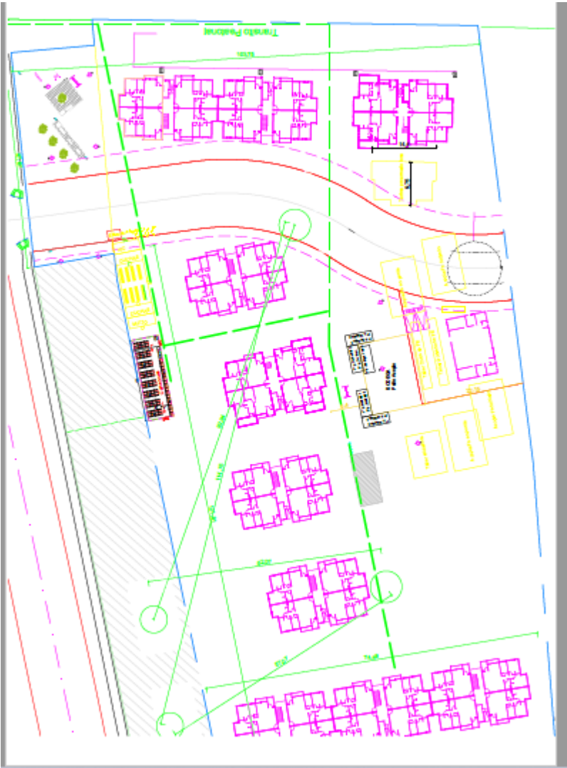
Plano Simple de Obra Las Uvas y el Viento