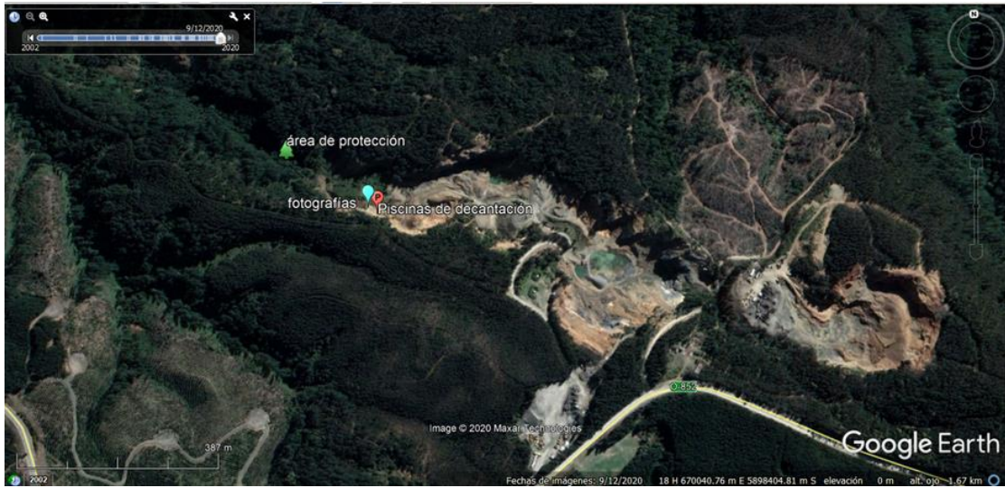
Imagen N° 3. Imagen Google Earth con la posición de las piscinas de decantación construidas (Fuente: elaboración propia en a base a Google Earth).