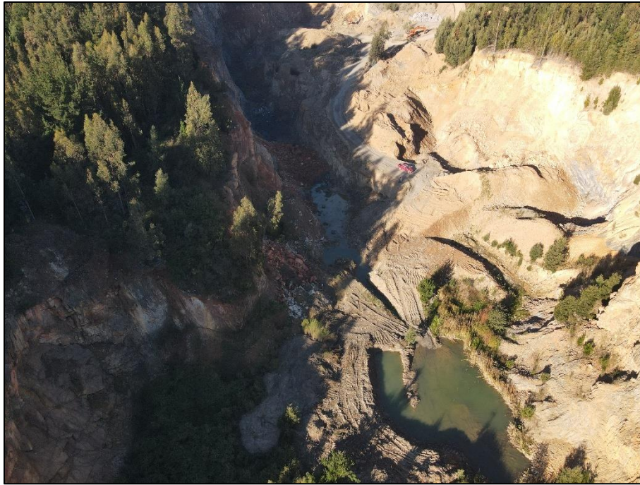
Figura N° 2. Piscinas de decantación despejadas (2) (Fecha: 10/05/2021).