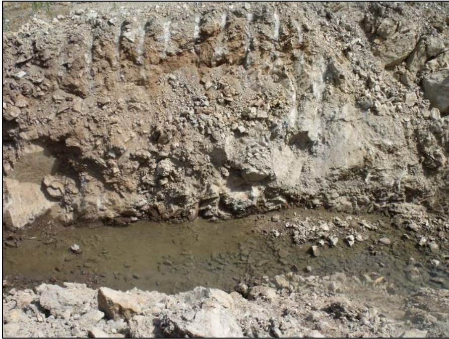
Imagen N° 5. Esguerrimiento natural del estero.

En las imágenes aéreas que se muestran a continuación (obtenidas a través de un dron) se aprecian las piscinas de decantación construidas por el titular.