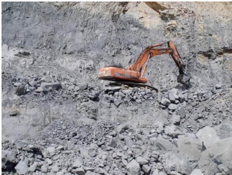
Imagen N° 6. Extracción con maquinaria pesada (se aprecia terraza).

Respecto del método de extracción, el material pétreo es extraído con la ayuda de maquinaria pesada, específicamente una excavadora, que va desprendiendo del frente de extracción la capa rocosa. Dicha capa extraída, tiene profundidad variable, por lo tanto, el régimen de extracción por sub zona, se mantiene de acuerdo a las características de los materiales. Actualmente, cuando se llega a los límites de la extracción se van dejando terrazas de 3.5 m máximo en todo el frente, para facilitar las acciones de cierre de frente como se aprecia en la figura siguiente.