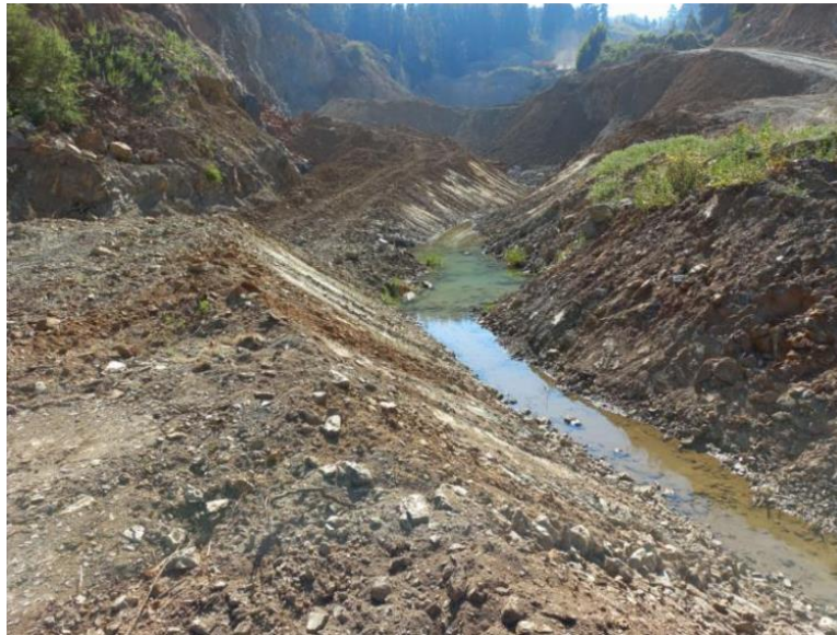
Imagen N° 2. Canalización de aguas.

Durante el año 2021, el titular procedió a mejorar la canalización al interior del predio, de manera de permitir el escurrimiento controlado de las aguas hacia las piscinas decantación construidas.