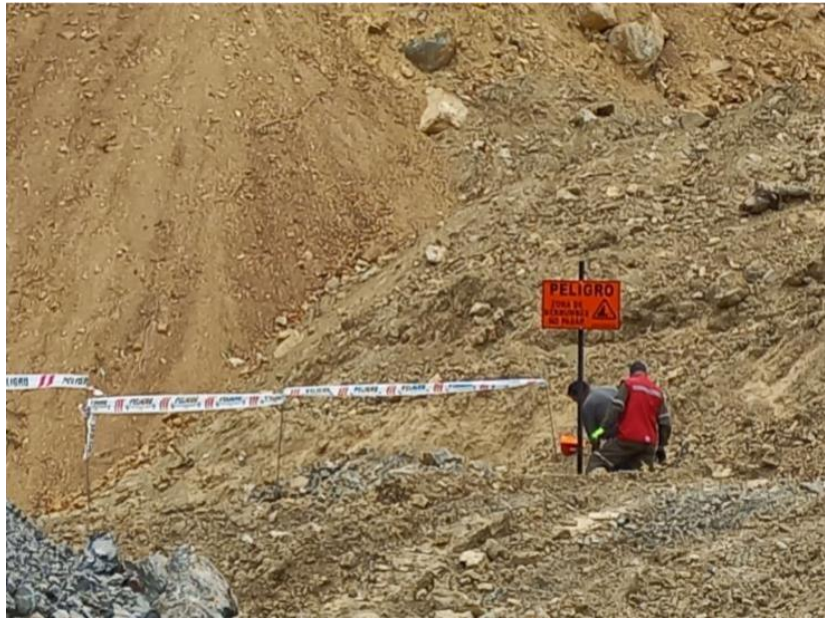
Imagen N° 8. Demarcación y señalización de zonas con derrumbes (octubre - noviembre 2021).