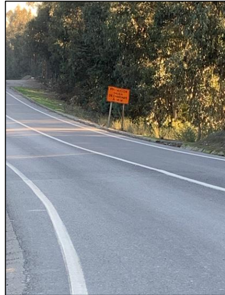
Señalización instalada en dirección hacia Coronel.