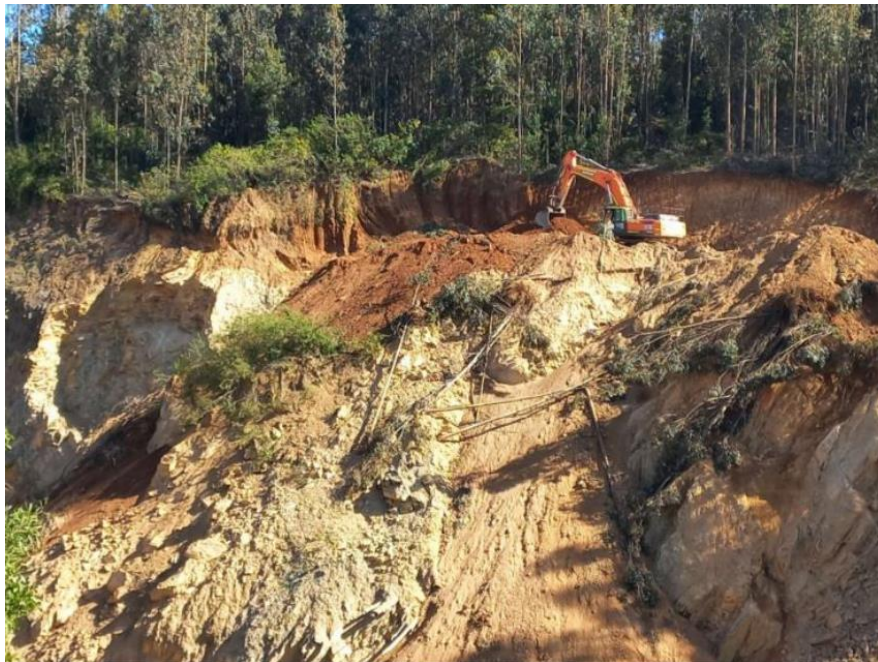
Imagen N° 11. Construcción de taludes en sector de derrumbe (noviembre 2021).