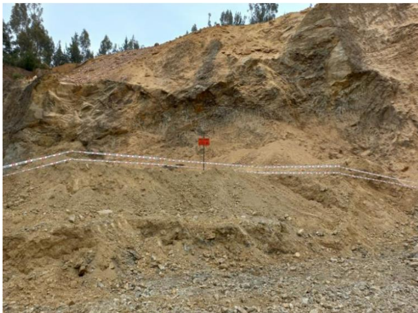
Imagen N° 9. Demarcación y señalización de zonas con derrumbes (octubre - noviembre 2021).