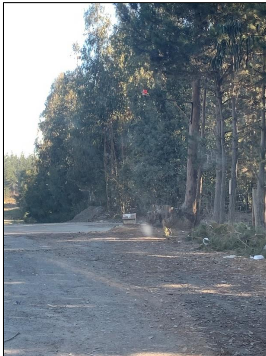
Imagen N° 13. Baliza de seguridad instalada por el titular en las proximidades del acceso a la Cantera.