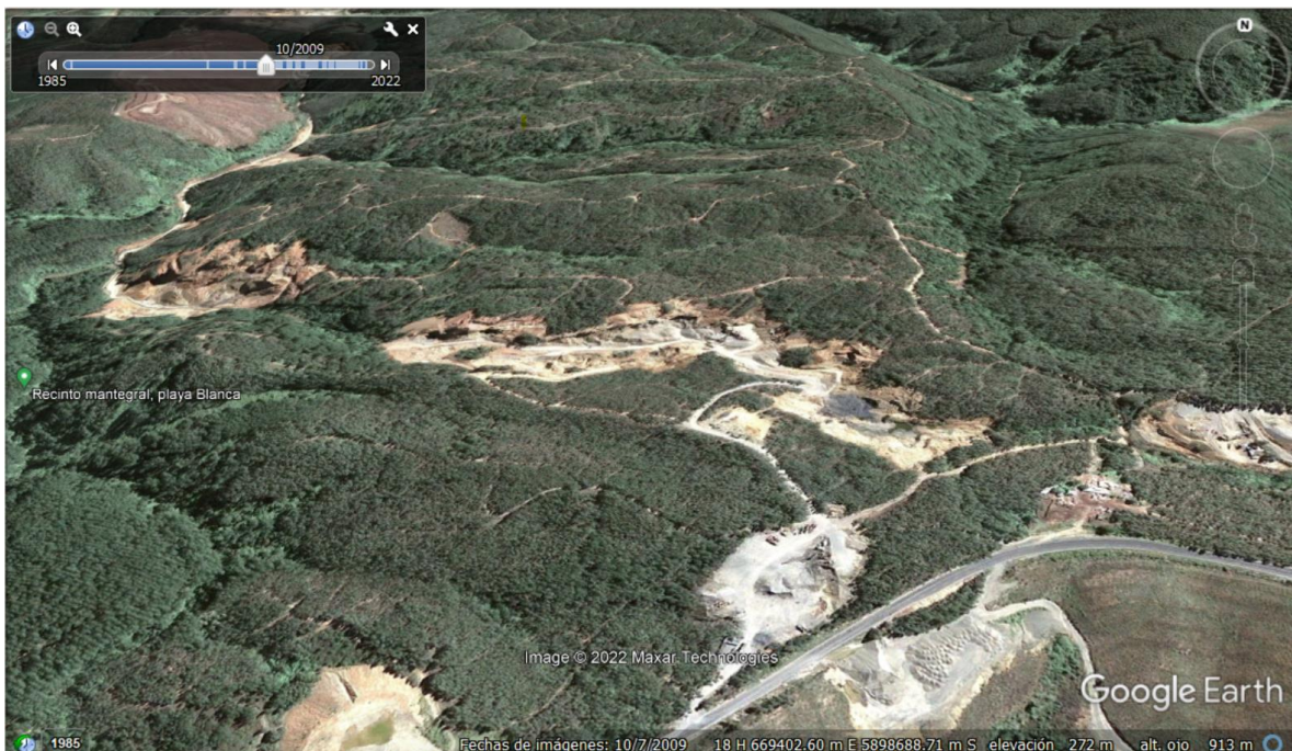
Imagen N° 1. Extracción de áridos en predio del proyecto previa al año 2013 (Fecha imagen: 10/2009).

Previo al año en el que se obtuvo la RCA, existía una extracción de áridos en el predio en el que se encuentra el proyecto, que no contaba con una RCA. Lo anterior, es posible de verificar en la siguiente imagen satelital: