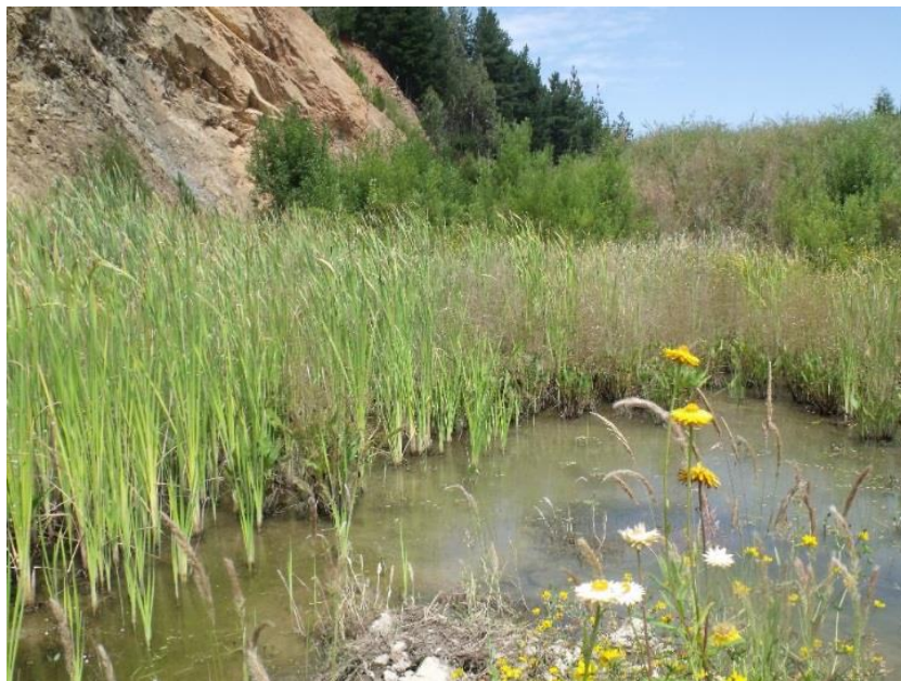
Imagen N° 4. Piscina de decantación construida (imagen previa a limpieza).