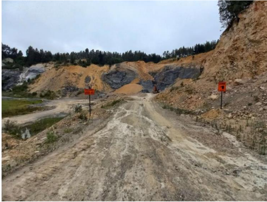
Imagen N° 10. Demarcación y señalización de zonas (octubre - noviembre 2021).