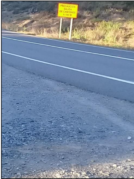
Señalización instalada en dirección hacia Patagual.