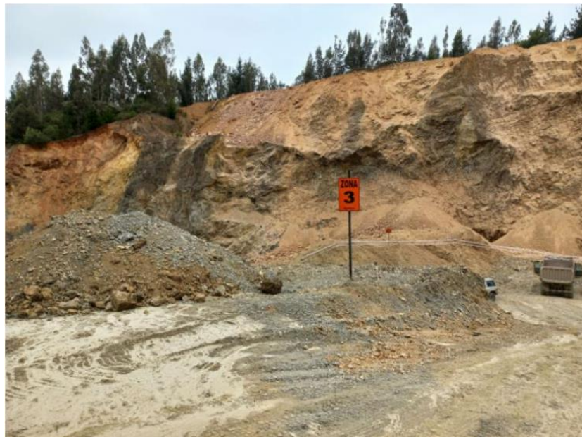
Imagen N° 7. Demarcación y señalización de zonas (octubre - noviembre 2021).

Las siguientes fotografías dan cuenta de las acciones implementadas por el titular.