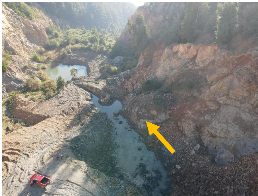
Figura N° 3. Escurrimiento de aguas hacia piscinas de decantación (Flecha indica dirección de escurrimiento de las aguas) (Fecha: 10/05/2021).