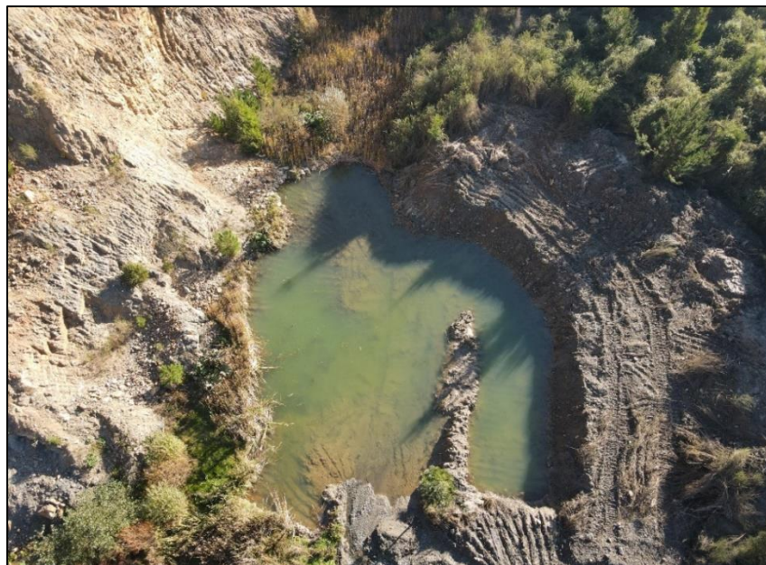
Figura N° 1. Piscinas de decantación despejadas (1) (Fecha: 10/05/2021).

En las imágenes aéreas que se muestran a continuación (obtenidas a través de un dron) se aprecian las piscinas de decantación construidas por el titular.