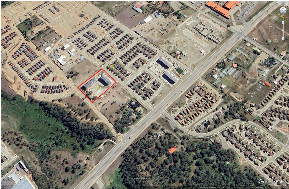
Figura 4: Situación a febrero de 2024 (en rojo polígono del proyecto)