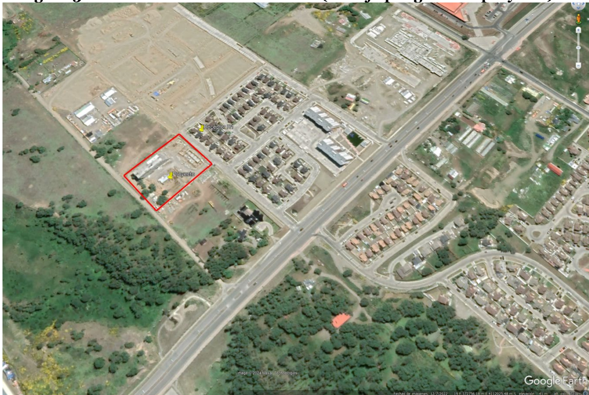
Figura 3: Situación a diciembre de 2022 (en rojo polígono del proyecto)