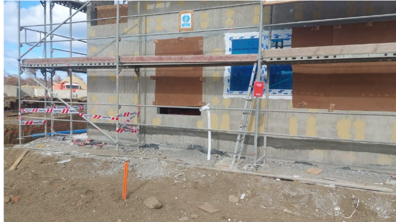
Figura 7: Vanos durante construcción de la obra gruesa