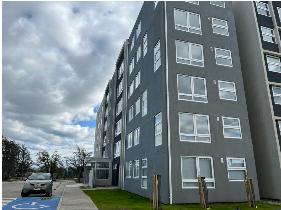
Figura 1: Imágenes que dan cuenta del edificio finalizado