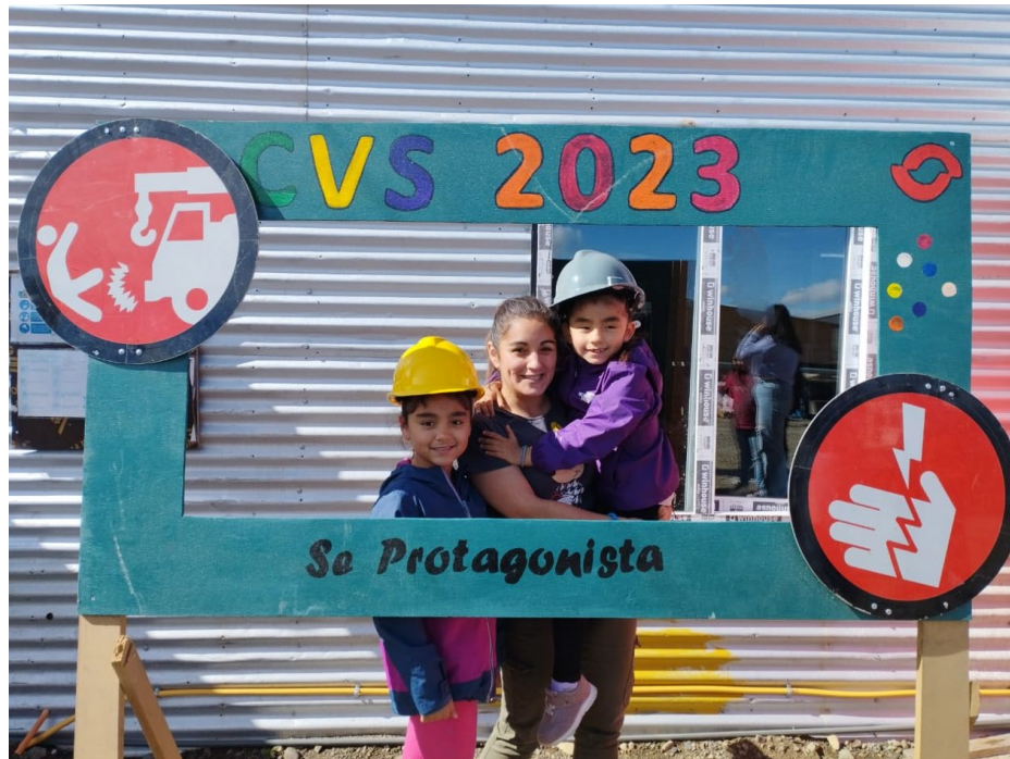
Figura 5: Fotografías de la actividad familiar realizada el 21 de enero de 2023

23. Las siguientes imágenes reflejan la visita de las familias a la obra el 21 de enero de 2023: