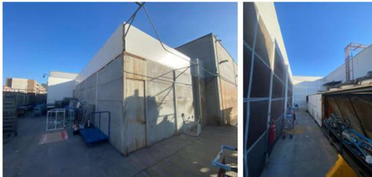
Imagen N°1: Barrera insonorizada perimetral en central en frío.

El titular, con la finalidad de dar cumplimiento a la Acción N°1 comprometida en el PdC, construyó una barrera conformada por paneles acústicos, emplazados alrededor de la central de frío, según consta en las siguientes imágenes: