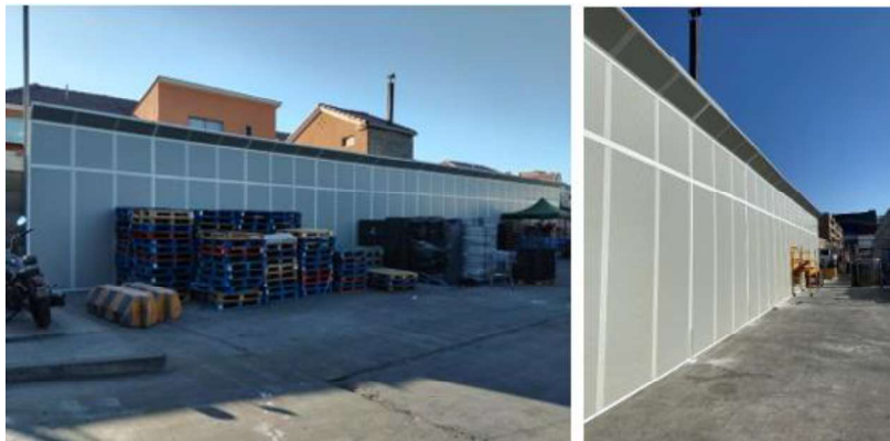
Imagen N°2: Barrera perimetral en sector de andén.

Asimismo, con la finalidad de dar cumplimiento a la Acción N°2 comprometida en el marco del PdC, el titular instaló barrera perimetral de 4,5 metros de altura en el sector de deslinde con las propiedades vecinas, a fin de mitigar los ruidos producidos por maniobras de operaciones en el andén.