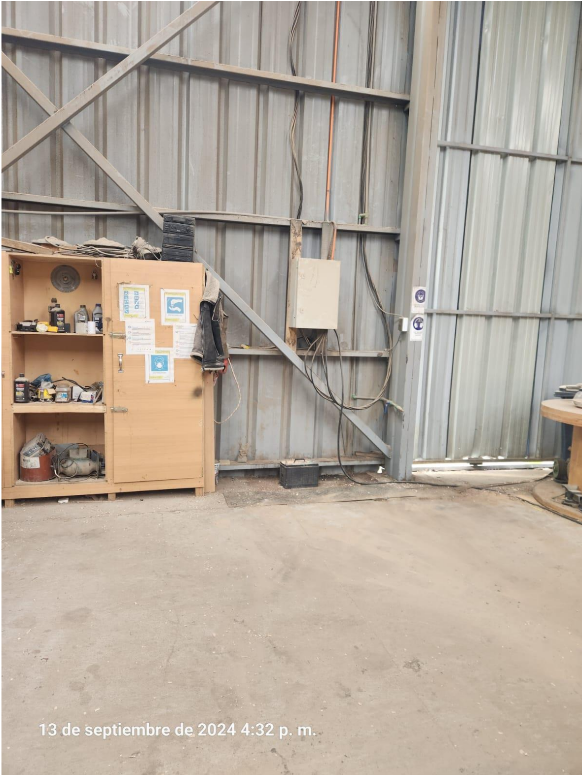
Lugar en Donde se utilizaba la maquina la cual se elimino .