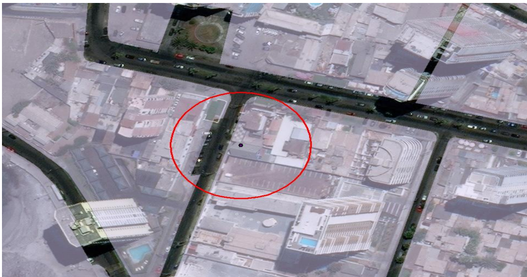
Figura N° 3 – Manzanas censales más cercanas a la fuente emisora

75. En conclusión, la presente circunstancia es aplicable al caso concreto, debido a que, si bien no existen antecedentes que permitan afirmar con certeza que haya personas cuya salud se vio afectada producto del funcionamiento de las