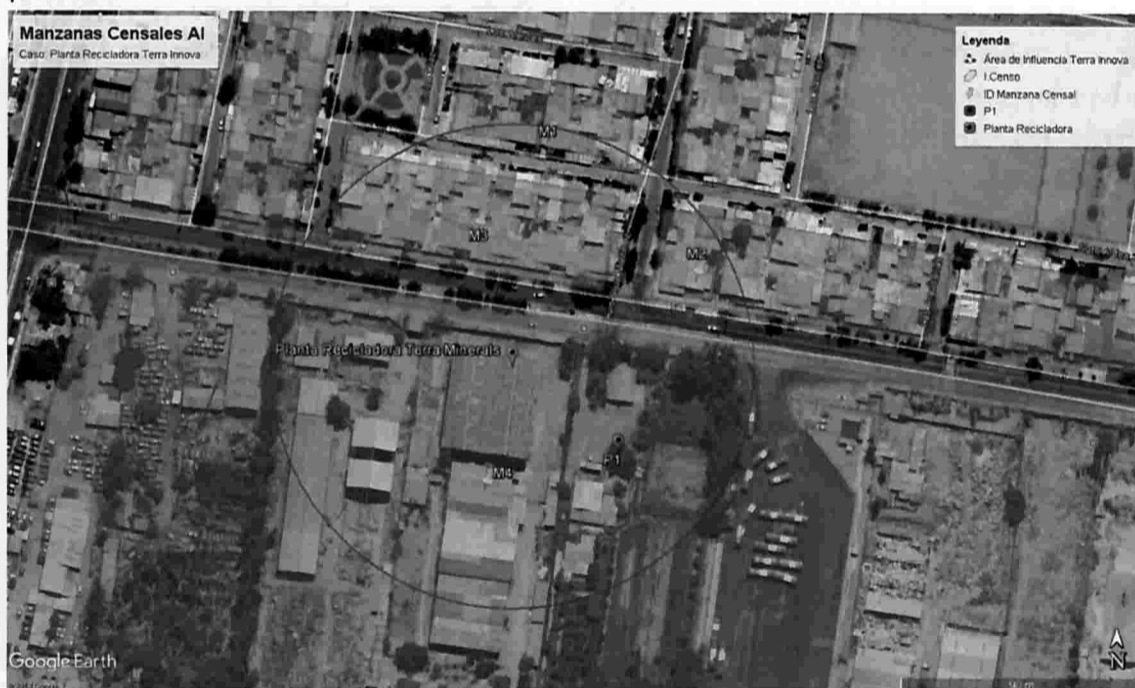
Ilustración 2 Manzanas censales identificadas dentro del Área de Influencia determinada para la fuente de ruido, Planta Recicladora Terra Innova.

92. En consecuencia, de acuerdo a lo presentado en la tabla 8, el número de personas que se estimó como potencialmente afectadas por la fuente emisora que habitan en el buffer identificado como AI, es de 188 personas.