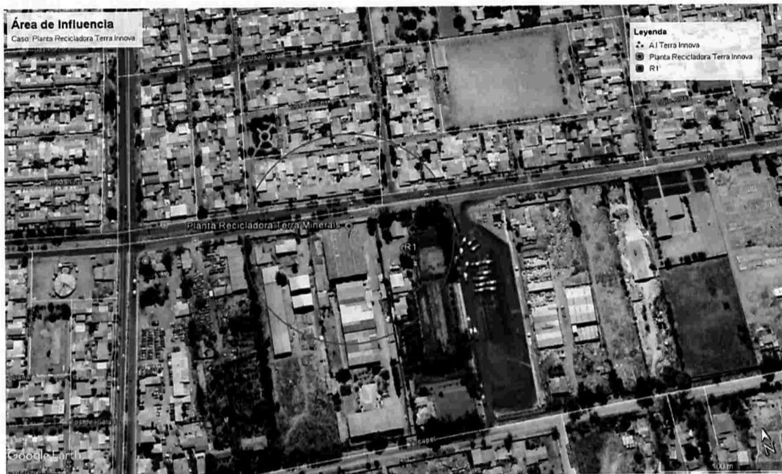
Ilustración 1 Determinación del Área de Influencia con un radio de 89 metros. Elaboración propia en base a software Google Earth. En color rojo se puede observar el perímetro del área de influencia determinada para la fuente "Planta Recicladora Terra Innova Chile S.A."

fecha 14 de diciembre de 2015, con un radio de 89 metros aproximadamente, circunstancia que se grafica en la siguiente imagen.