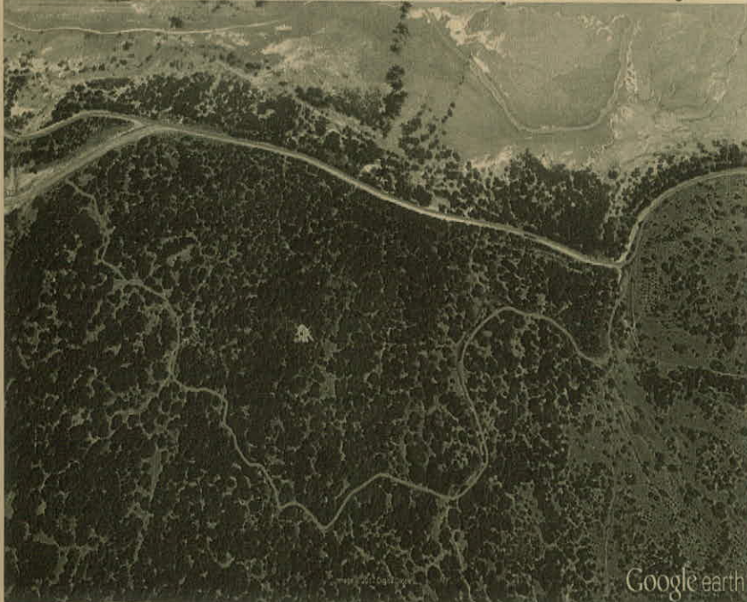
Figura N°3: Imagen Satelital área camino, de fecha 27 de noviembre de 2013, con demarcaciones. En verde, caminos descritos por CODELCO Teniente en su respuesta a la solicitud de información efectuado por la SMA con fecha 7 de febrero de 2017; en rojo, huella preintervenida, según apreciación visual de la imagen.

278. Observando el detalle de la imagen en su versión digital, se puede apreciar que en parte del camino objeto de cargos existe una huella menor, de una dimensión mucho menor de las dimensiones de los caminos vehiculares colindantes. En parte del camino no se puede apreciar esta huella menor.