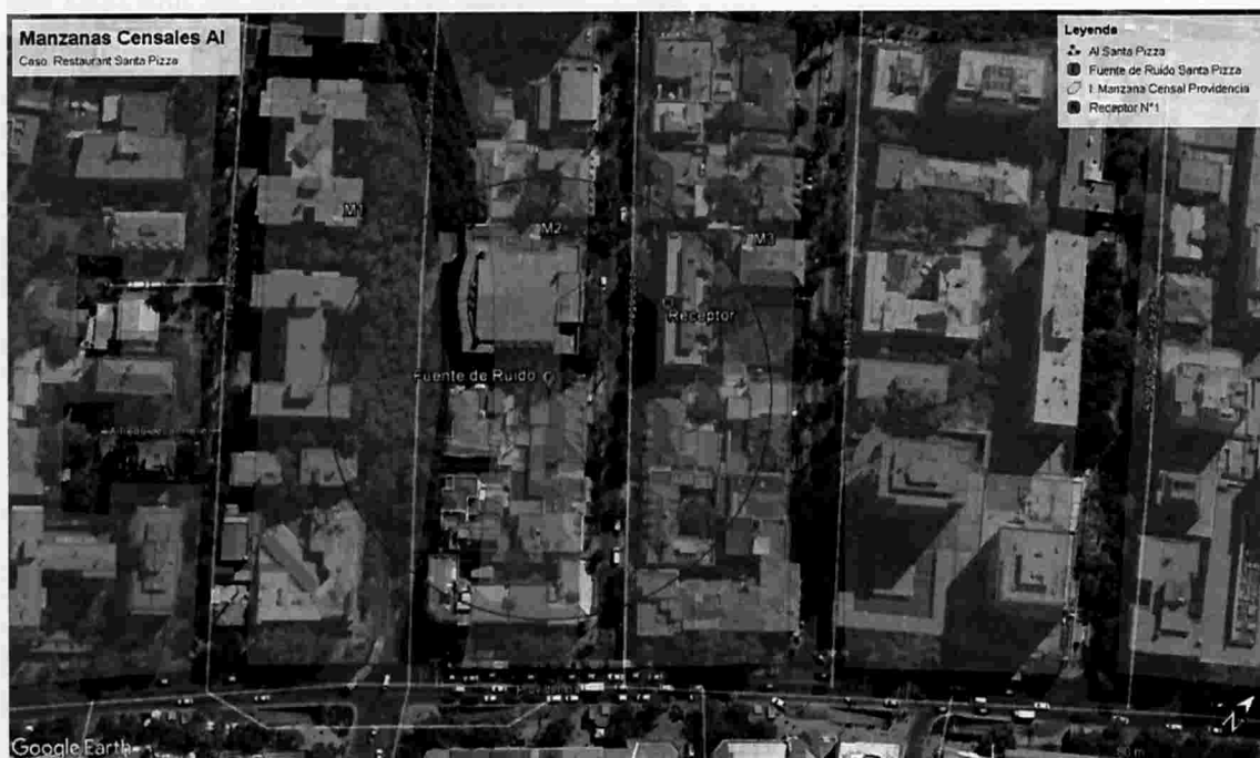
Ilustración 2 Manzanas censales identificadas dentro del Área de Influencia determinada para la fuente de ruido, "Santa Pizza Providencia".

125. En consecuencia, de acuerdo a lo presentado en la tabla 5, el número de personas que se estimó como potencialmente afectadas por la fuente emisora, que habitan en el buffer identificado como AI, es de 79 personas.