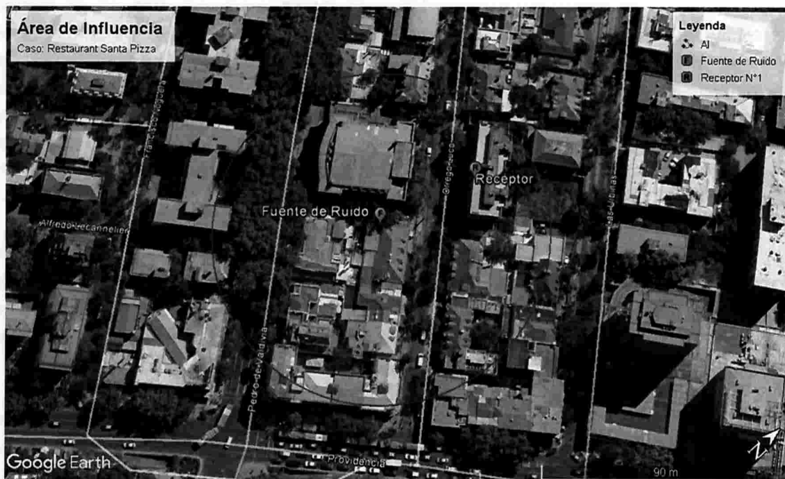
Ilustración 1 Determinación del Área de Influencia con un radio de 67 metros. Elaboración propia en base a software Google Earth. En color rojo se puede observar el perímetro del área de influencia determinada para la fuente "Santa Piza, Orrego Luco".

121. De este modo, se determinó un Área de Influencia o Buffer cuyo centro corresponde al domicilio de la fuente emisora que fue determinado mediante las coordenadas geográficas indicadas en el Informe de medición de Ruidos de fecha contenido en el Acta de Fiscalización de fecha 9 de septiembre de 2015, con un radio de 67 metros aproximadamente, circunstancia que se grafica en la siguiente imagen.