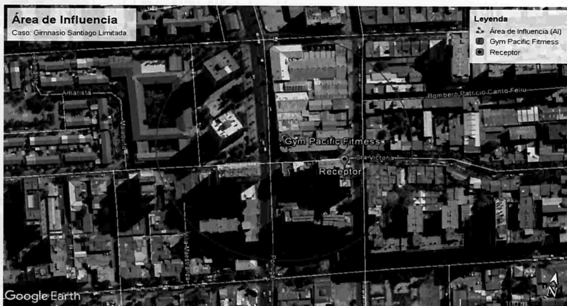
Ilustración 1 Determinación del Área de Influencia con un radio de 114 metros. Elaboración propia en base a software Google Earth. En color rojo se puede observar el perímetro del área de influencia determinada para la fuente "Gym Pacific Portugal".

97. Una vez obtenida el Área de Influencia de la fuente, se procedió a interceptar dicho buffer, con la información georreferenciada del Censo 2017. Dicha información de carácter público, consiste en una cobertura de las manzanas censales 28 de cada una de las comunas, de la Región Metropolitana 29 . Para la determinación del número de personas existente en el Área de Influencia, se utilizó el indicador de la base de datos Censal, "número de personas", el que da cuenta del número de personas total existente de cada una de las manzanas censales de la Región Metropolitana, de acuerdo al Censo 2017. Ahora bien, en el caso particular del Área de Influencia de la fuente Gimnasio Pacific Portugal, se identificó que dicha área de influencia intercepta 7 manzanas censales.