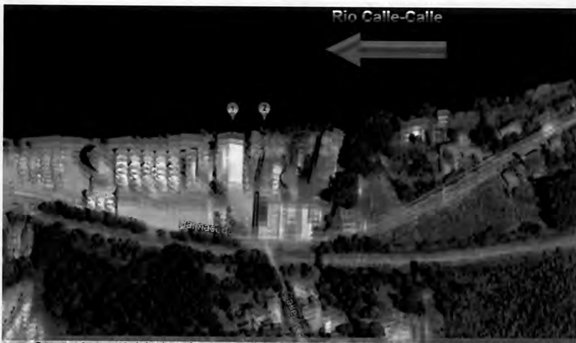
Imagen 4. Cambio de ubicación en descarga del efluente de Planta de Levaduras Collico al río Calle Calle.