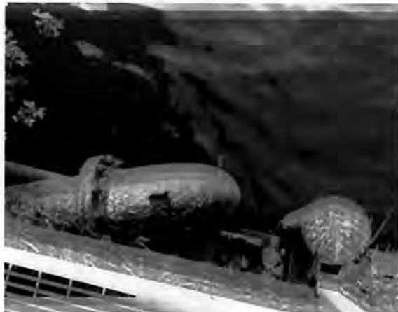
Imagen 1. Ducto de descarga de riles fiscalizado con fecha 15 de octubre de 2015, ubicado en ribera del río Calle-Calle, introduciéndose un metro de profundidad en el cauce.