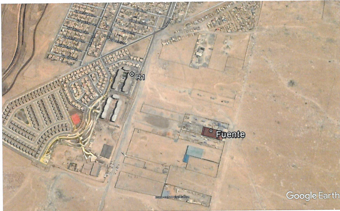
Imagen 1. Ubicación del receptor sensible R1 actividad de fiscalización de fecha 8 de enero de 2017