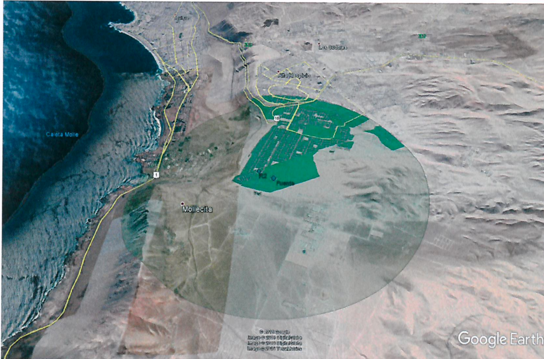
Imagen 4. Área de Influencia definida por propagación de sonido desde fuente emisora