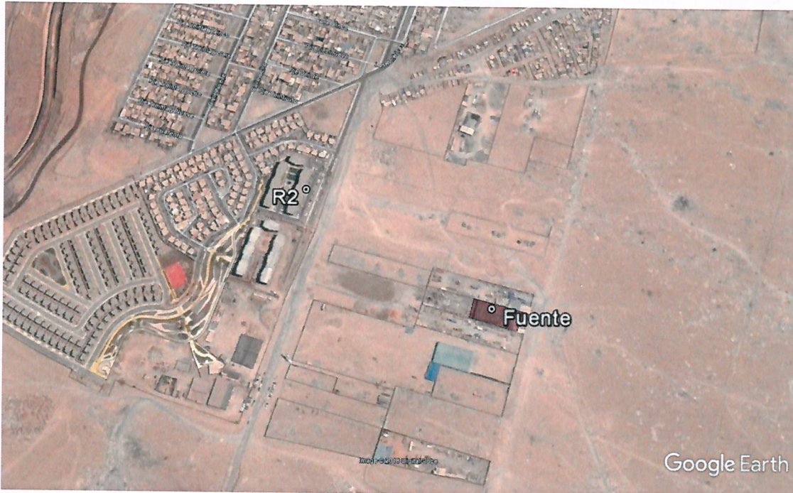
Imagen 2. Ubicación del receptor sensible R2 actividad de fiscalización de fecha 8 de enero de 2017