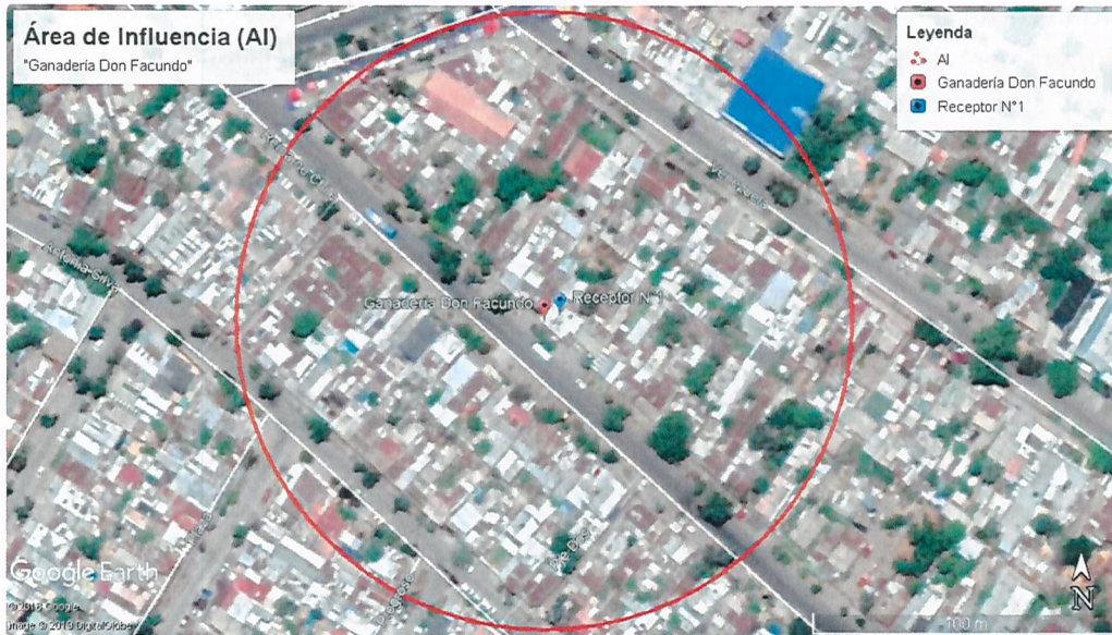
Imagen N° 1: Área de Influencia (AI)

En color rojo se puede observar el perímetro del área de influencia determinada para la fuente "Ganadería Don Facundo".