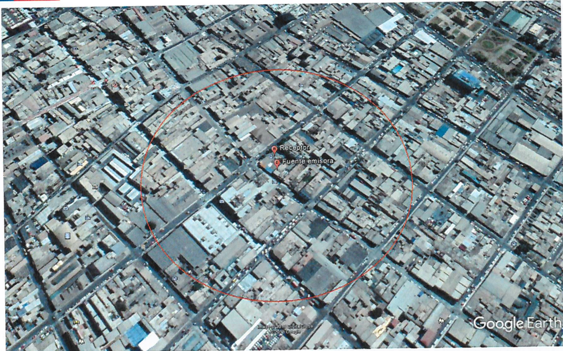
Imagen N° 1 Determinación del Área de Influencia con un radio de 170 metros. Elaboración propia en base a software Google Earth. En color rojo se puede observar el perímetro del área de influencia determinada para la fuente Bar Restaurant "La Posta"

119. Una vez obtenida el Área de Influencia de la fuente, se procedió a interceptar dicho buffer, con la información georreferenciada del Censo 2017. Al respecto, se hace presente que dicha información de carácter público, consiste en una cobertura de las manzanas censales 30 de cada una de las comunas de la Región de Arica y Parinacota 31 .