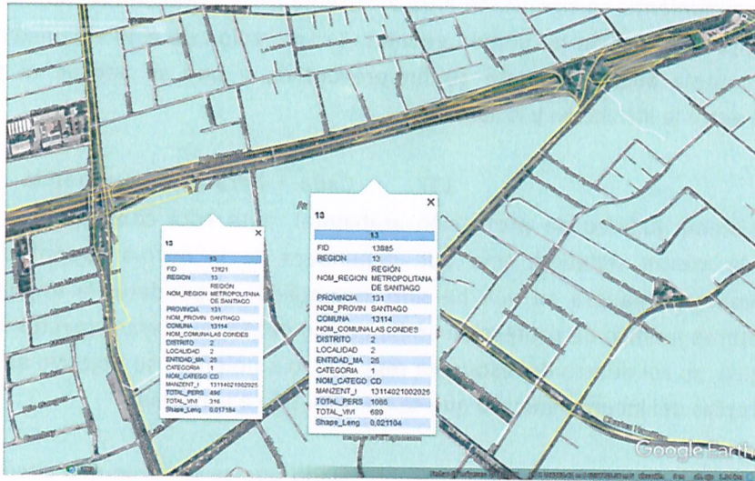
Imagen N° 3: Propuesta de manzanas censales afectadas por fuente Club Palestino

133. A continuación se presenta, en la tabla N° 5, la información correspondiente a cada manzana censal el AI definida, indicando: ID correspondiente por manzana censal, ID definido para el presente procedimiento sancionatorio (ID PS), sus respectivas áreas totales y número de personas en cada manzana, registrándose un total de 1.562 personas. Asimismo, se indica la cantidad estimada de personas que pudieron ser afectadas, determinada a partir de proporción del AI sobre el área total, bajo el supuesto que la distribución de la población determinada para cada manzana censal es homogénea.