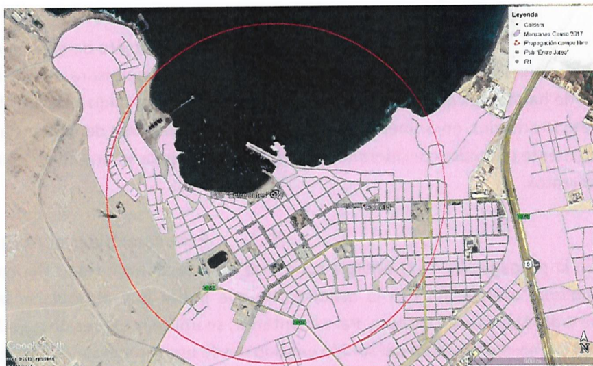
Imagen 1: Determinación del Área de Influencia propagación sonora en campo libre, con un radio de 1.153 metros. Elaboración propia en base a software Google Earth. En color rojo se puede observar el perímetro del área de influencia determinada para la fuente "Pub Entre Jotes".

100. Sin embargo, en este caso en particular, no se considerará la ecuación de propagación, toda vez que, como puede observarse en la imagen N°1, el área resultante se considera excesiva, abarcando alrededor de la totalidad de las manzanas censales de la comuna de Caldera, si se compara con el entramado urbano de la zona específica cercana a la fuente de emisión, y la respectiva distribución de las edificaciones cercanas al local. Así, se concluye que, en el caso particular, este método no es el mejor estimador para calcular dicha área, en circunstancias que es posible evidenciar que el área de influencia, razonablemente estaría circunscrita a las manzanas adyacentes a la fuente, sobreestimando entonces dicha área, por lo que, en este caso, resulta razonable ajustar esta metodología como se explicará a continuación. Por otro lado, no constan en esta Superintendencia otras denuncias asociadas a la mencionada instalación, que puedan indicar que dicha área de influencia pueda ser más extensa que lo señalado.