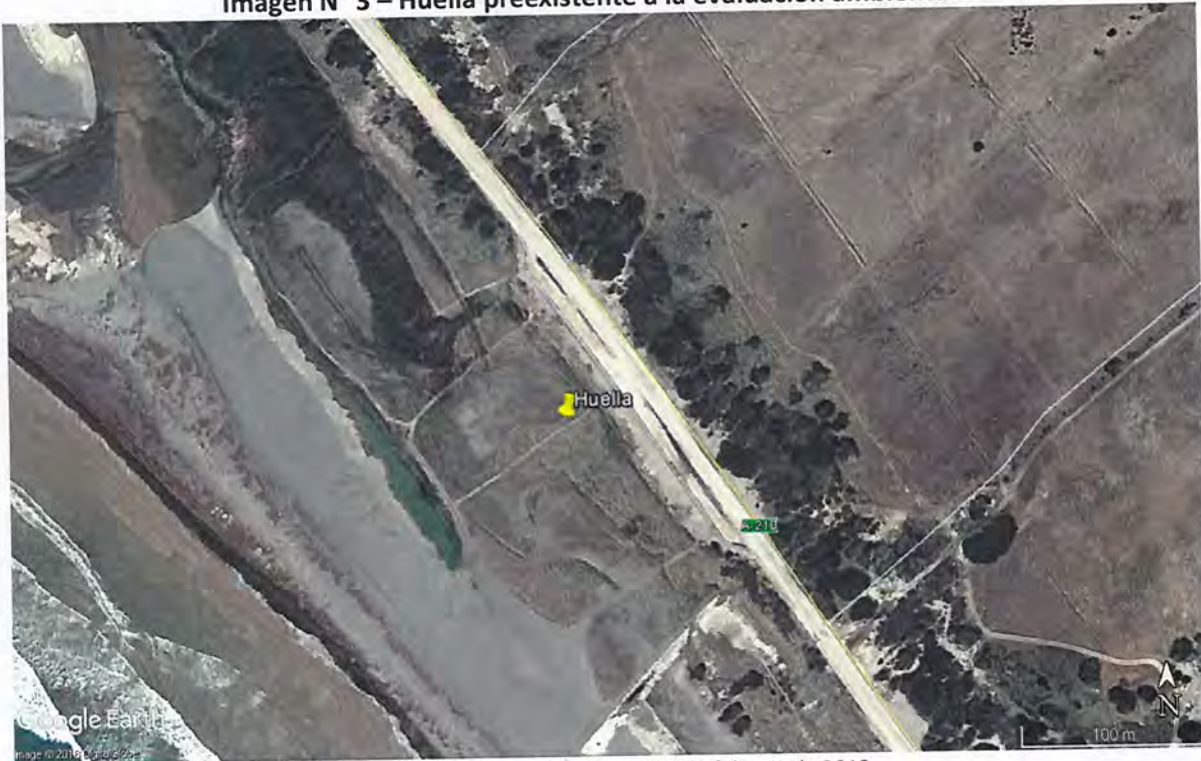
Imagen N° 3 – Huella preexistente a la evaluación ambiental

Imagen de 21 de febrero de 2012.