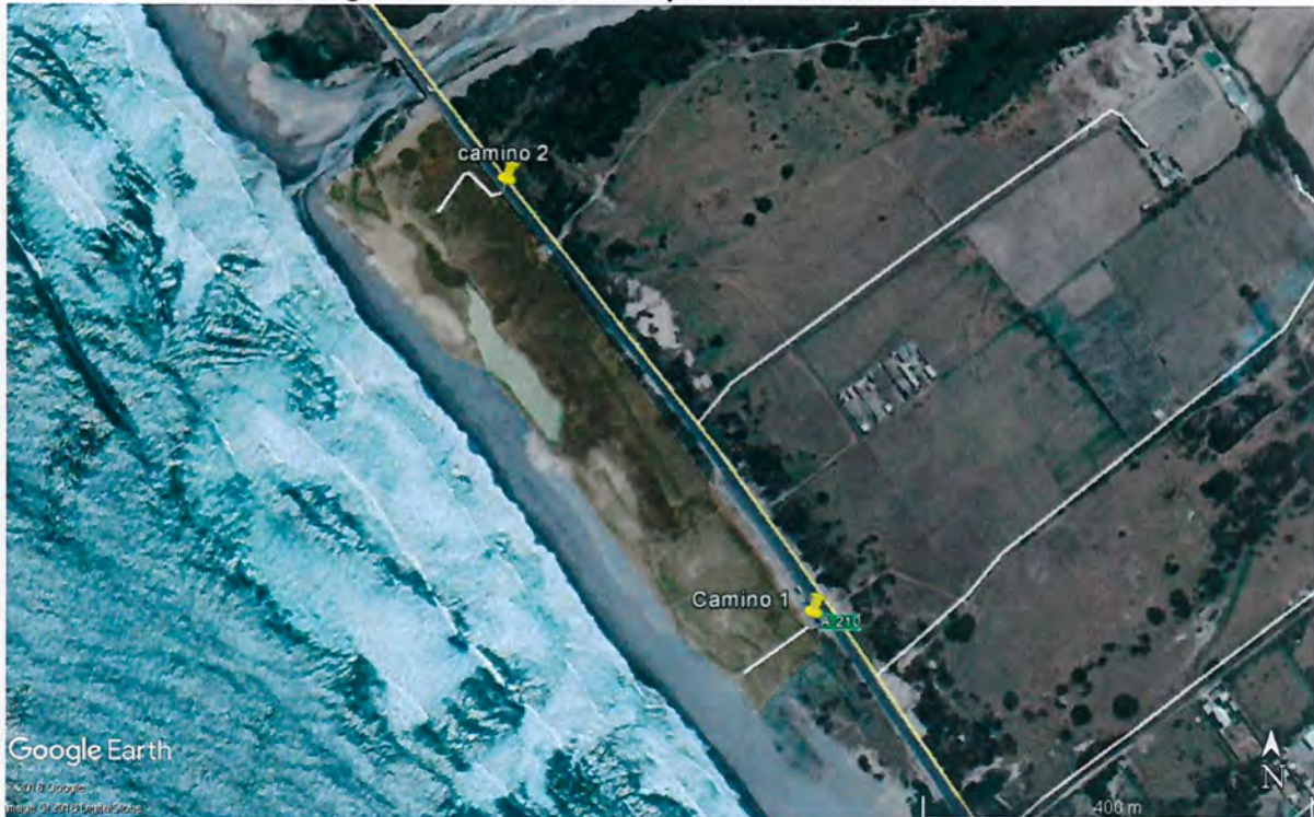
Imagen N° 2 – Senderos desprovistos de demarcación