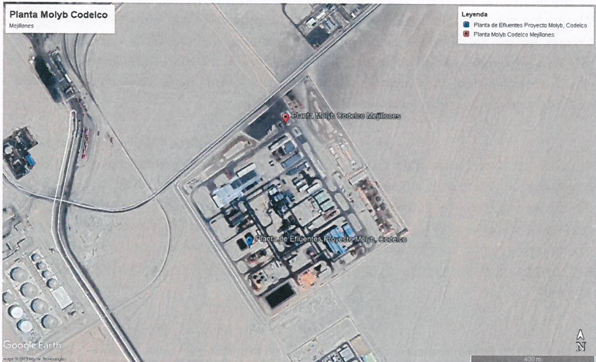
Imagen 1. Complejo MOLYB CODELCO Chile