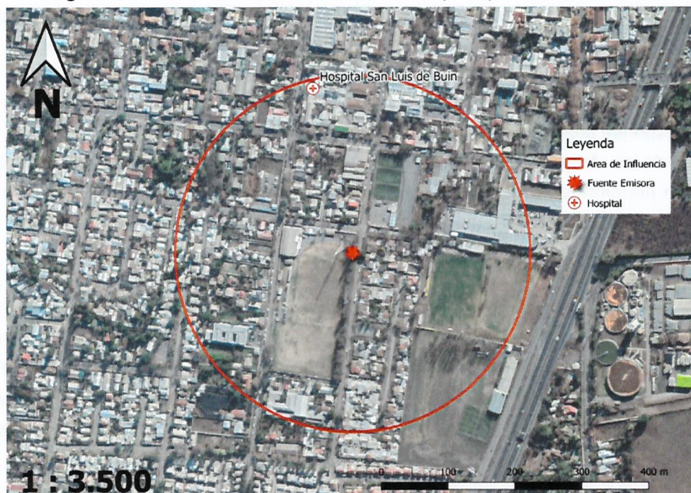
Imagen N° 1: Intersección de Área de Influencia y Hospital San Luis de Buin.