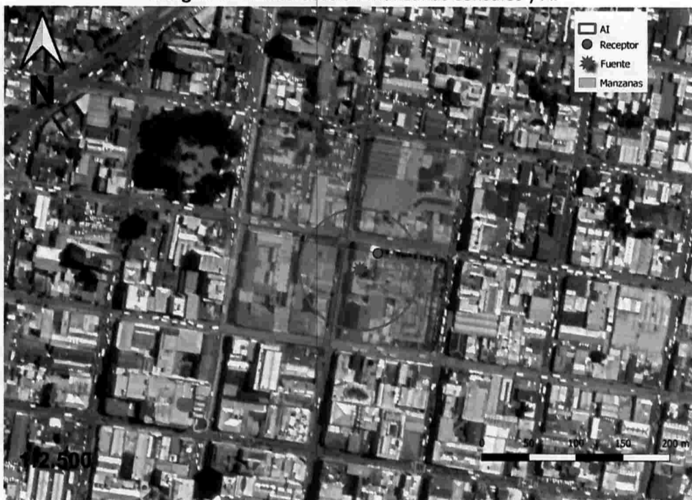
Imagen N° 1: Intersección manzanas censales y AI