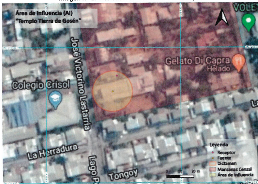
Imagen N° 1: Intersección manzanas censales y AI