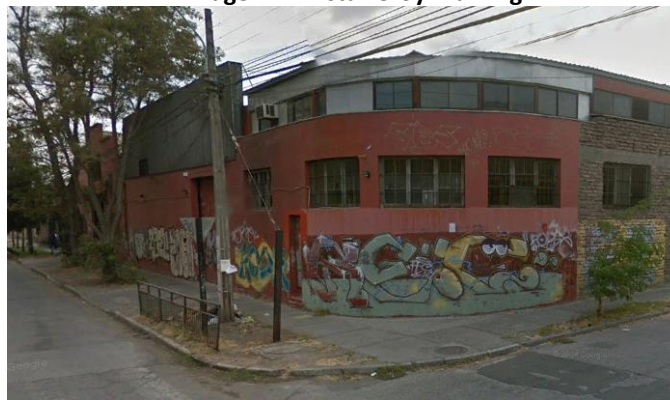
Imagen 1 - Vista Leroy Training

vidrio común delante de las ventanas originales sin correderas, las que serían 10, de acuerdo a la imagen obtenida por Google Street View Google Street View Google Street View (4 ventanas 200x180 cm y 6 de 120x160 cm). Para realizar este cálculo se utilizó una cotización online de ventana en Sodimac de unas ventanas de medidas 140 x120, y luego, utilizando un supuesto conservador, estas se proporcionaron a las medidas indicadas con anterioridad; y, ii) instalar un limitador acústico para controlar la emisión de ruido desde los equipos de música. Respecto del costo del reforzamiento acústico de ventanas, se consideró un costo unitario de ventana estándar de $4,7/cm 2 según cotización singularizada en la Tabla N°4, asumiendo que el costo de las ventanas requeridas en este caso es el mismo. Así las cosas, el monto total por fabricación, flete e instalación de ventanas asciende a $ 1.499.097, equivalentes a 2,3 UTA. Finalmente, se referencia el costo de un limitador acústico para controlar la emisión de ruido de parlantes por un monto de $ 1.864.273, equivalentes a 2,9 UTA.