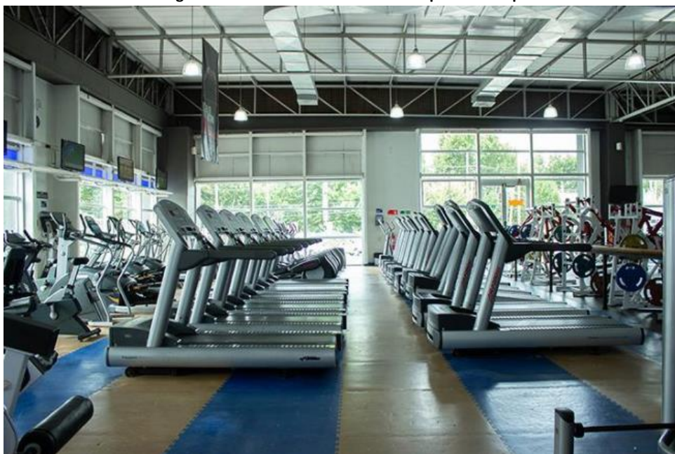
Imagen N°1: Vista desde el interior de Sportlife Maipú.