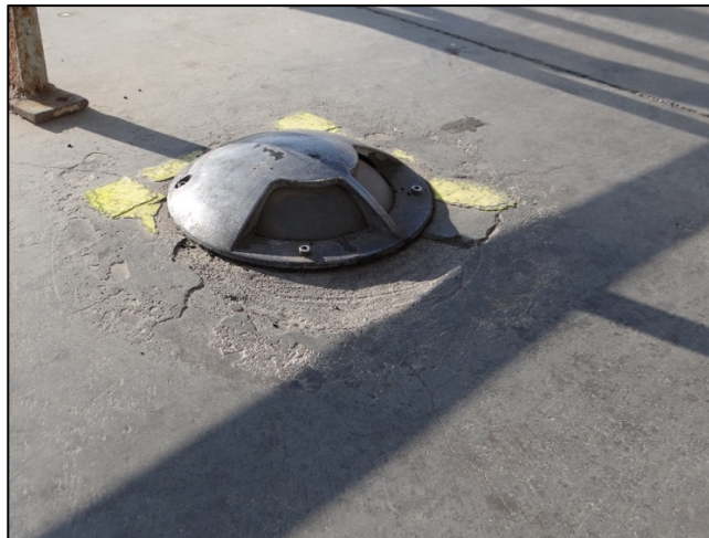
Ilustración 1. Luminaria N° 3