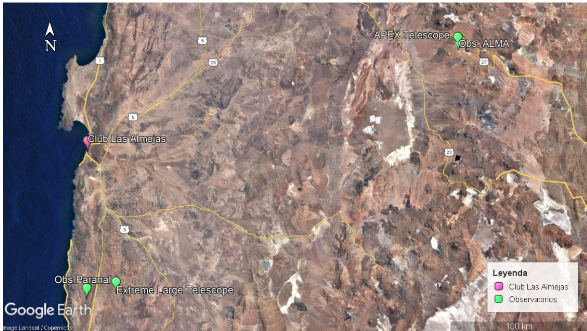
Ilustración 4. Ubicación geográfica de Cancha Las Almejas y observatorios astronómicos