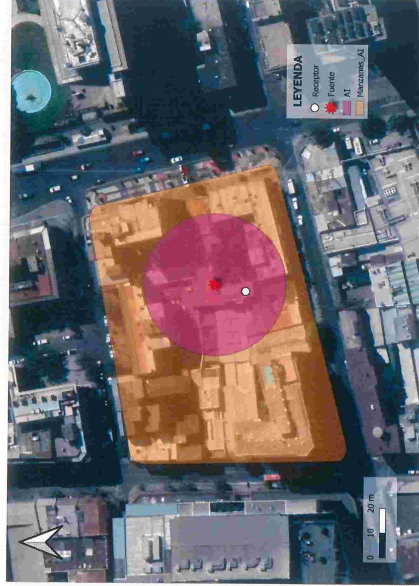
Imagen 1. Intersección manzanas censales y AI