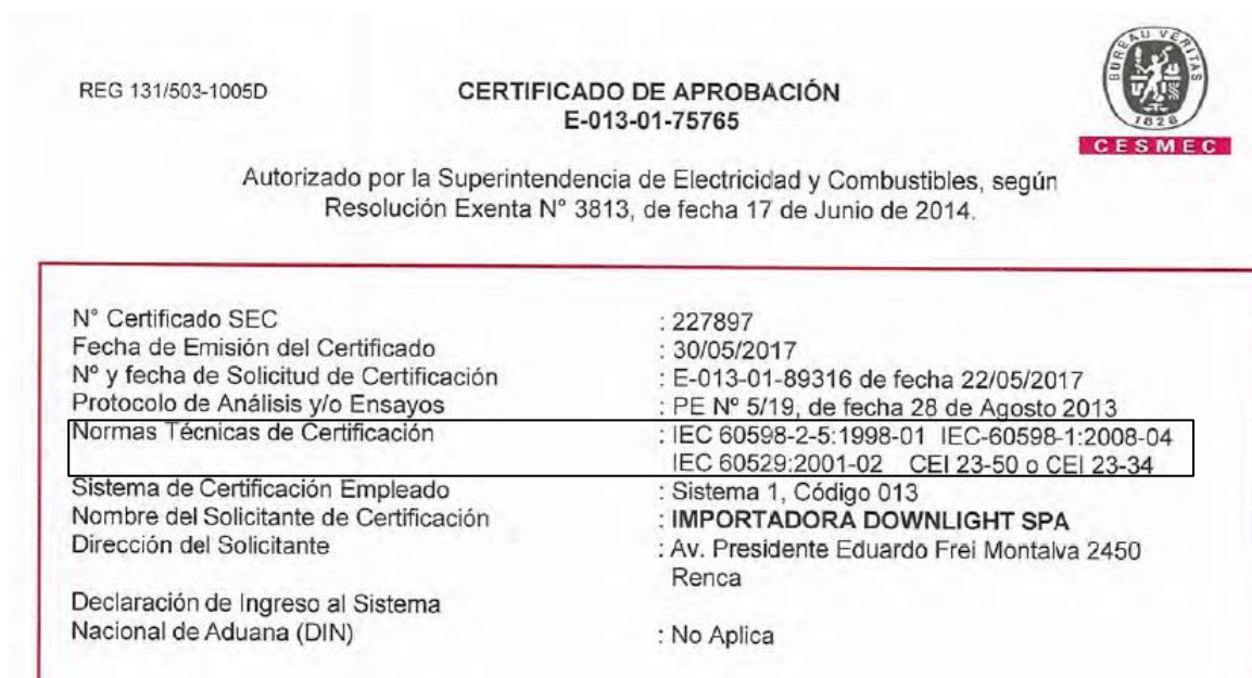
Ilustración 1. Certificado de Aprobación E-013-01-75765.

Fuente: Anexo N° 2, IFA DFZ-2020-2573-IV-NE