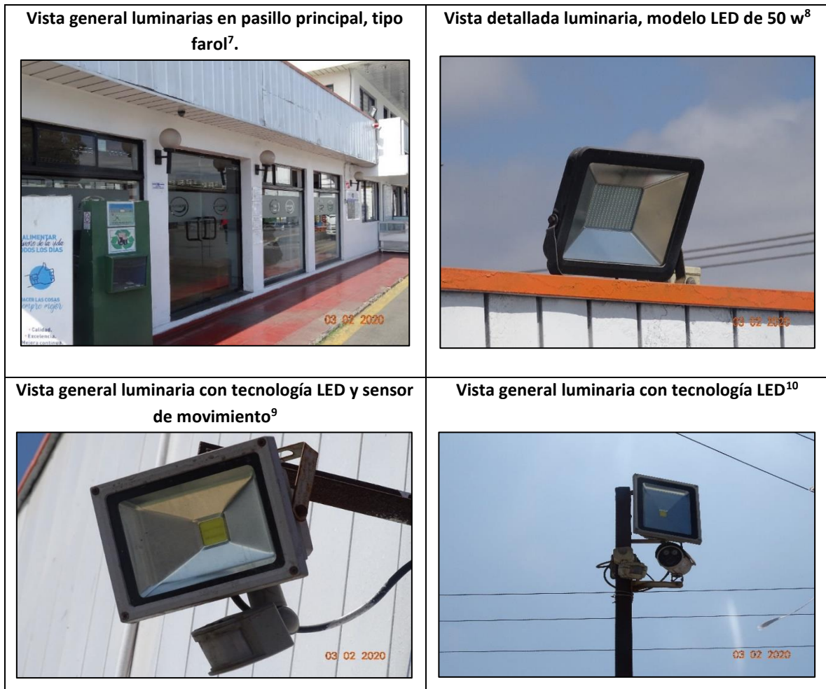
Ilustración 2, 3, 4 y 5. Vista de las luminarias instaladas en CDA