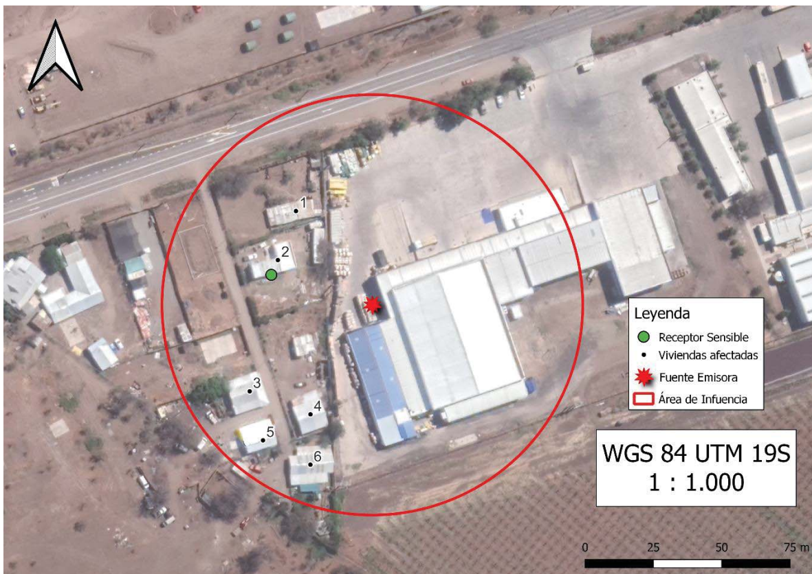
Imagen 1. Intersección manzanas censales y AI